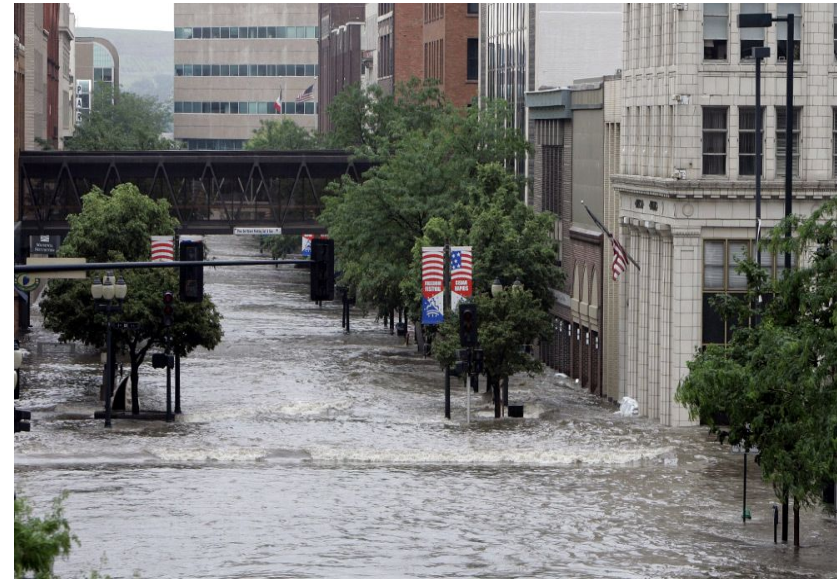
Фото пострадавшего от наводнения города Сидар-Рapid штата Айова, США. Июнь 2008г.