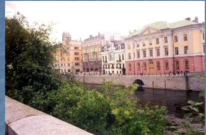
Панорама Гамла-Стана — средневековой части Стокгольма, основанного в 1252 году.