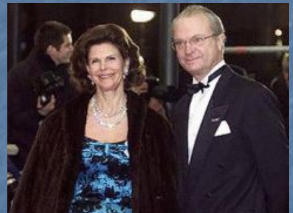
Королева Сильвия и король Карл XVI Густав