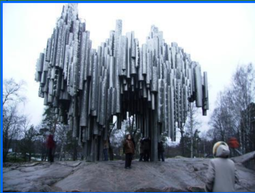
Памятник Яну Сибелиусу