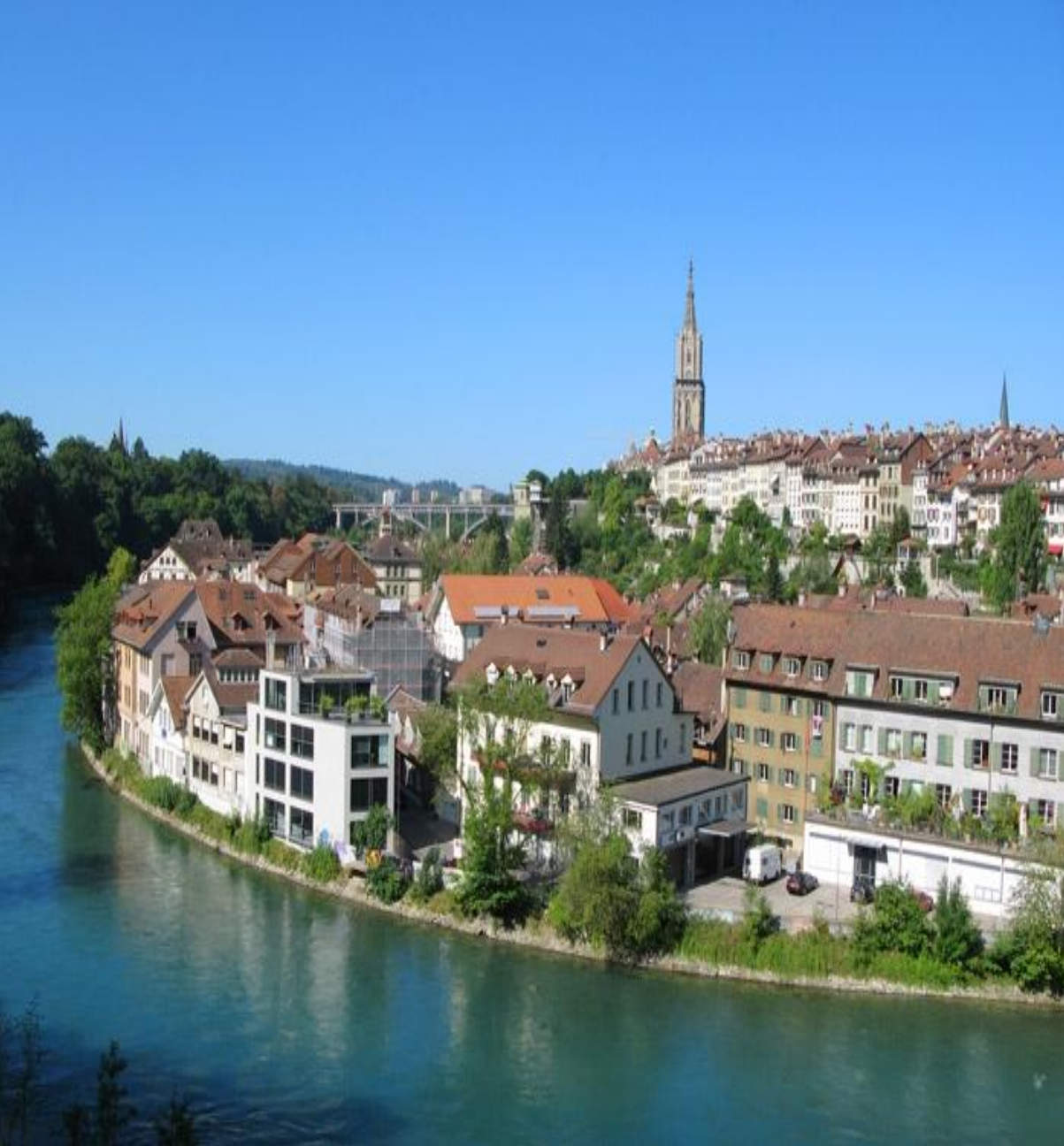
Ескі қала - Берна