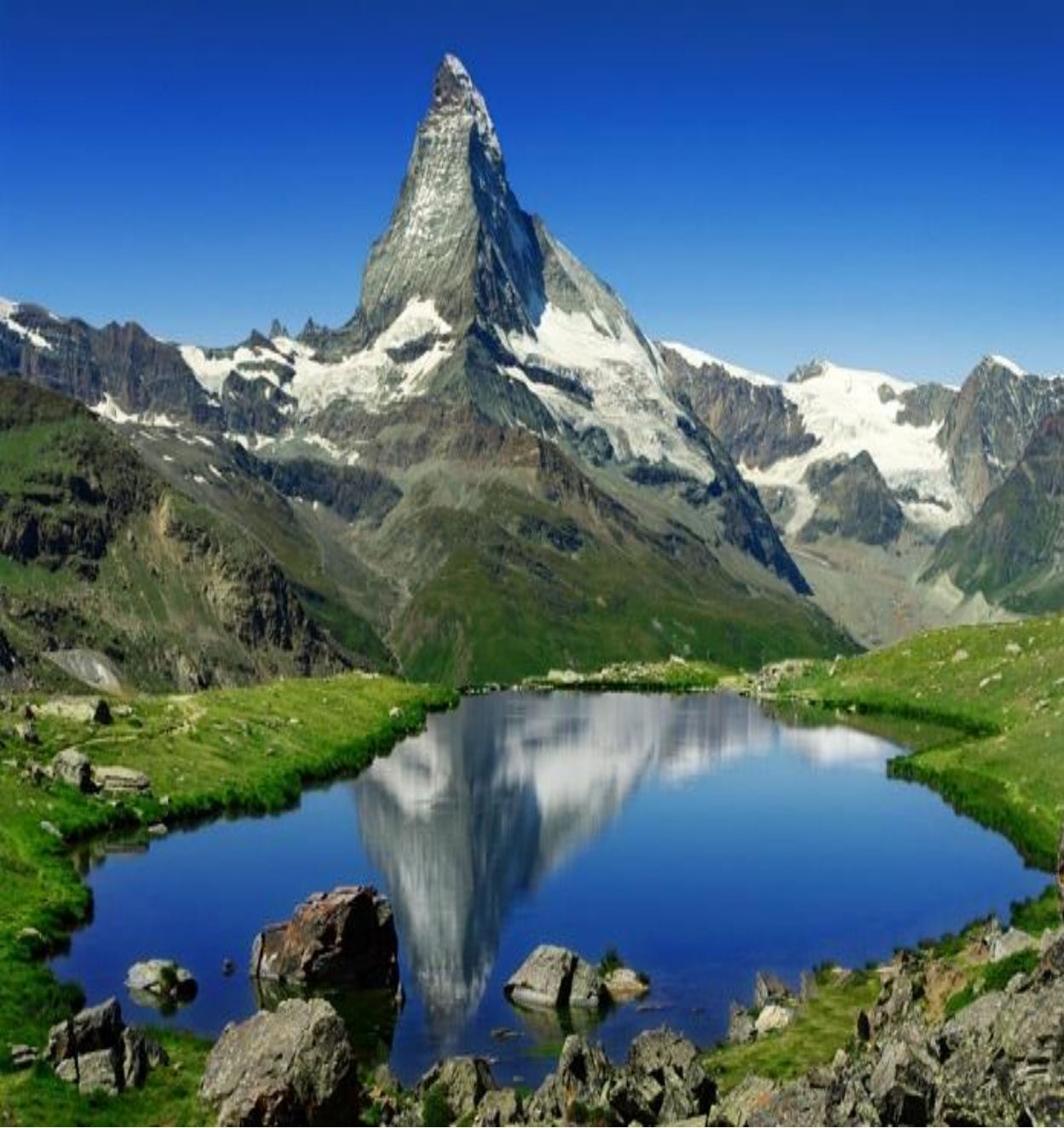
Швейцарияның символы – Маттерхорн тауы