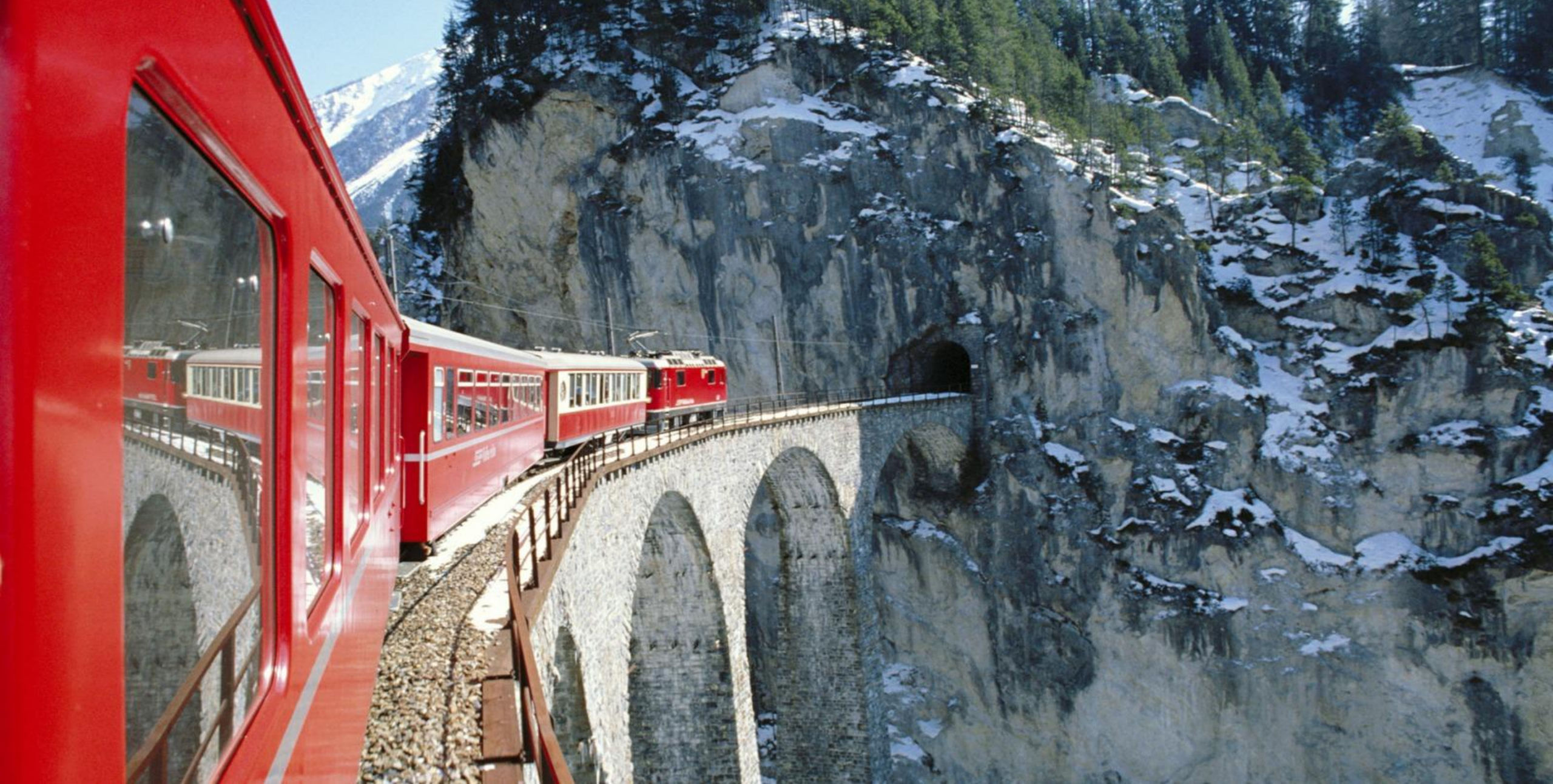
Тау ішіндегі Аспалы темір жол