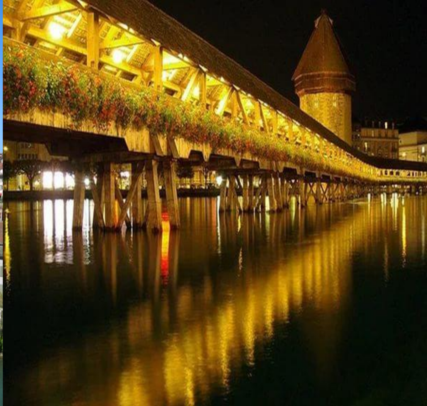
Капельбрюкке аспалы көпірі