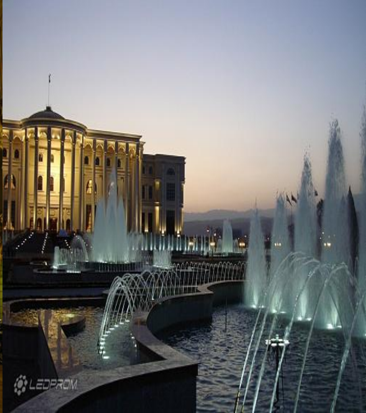
Женевадағы Ұлттар Сарайы