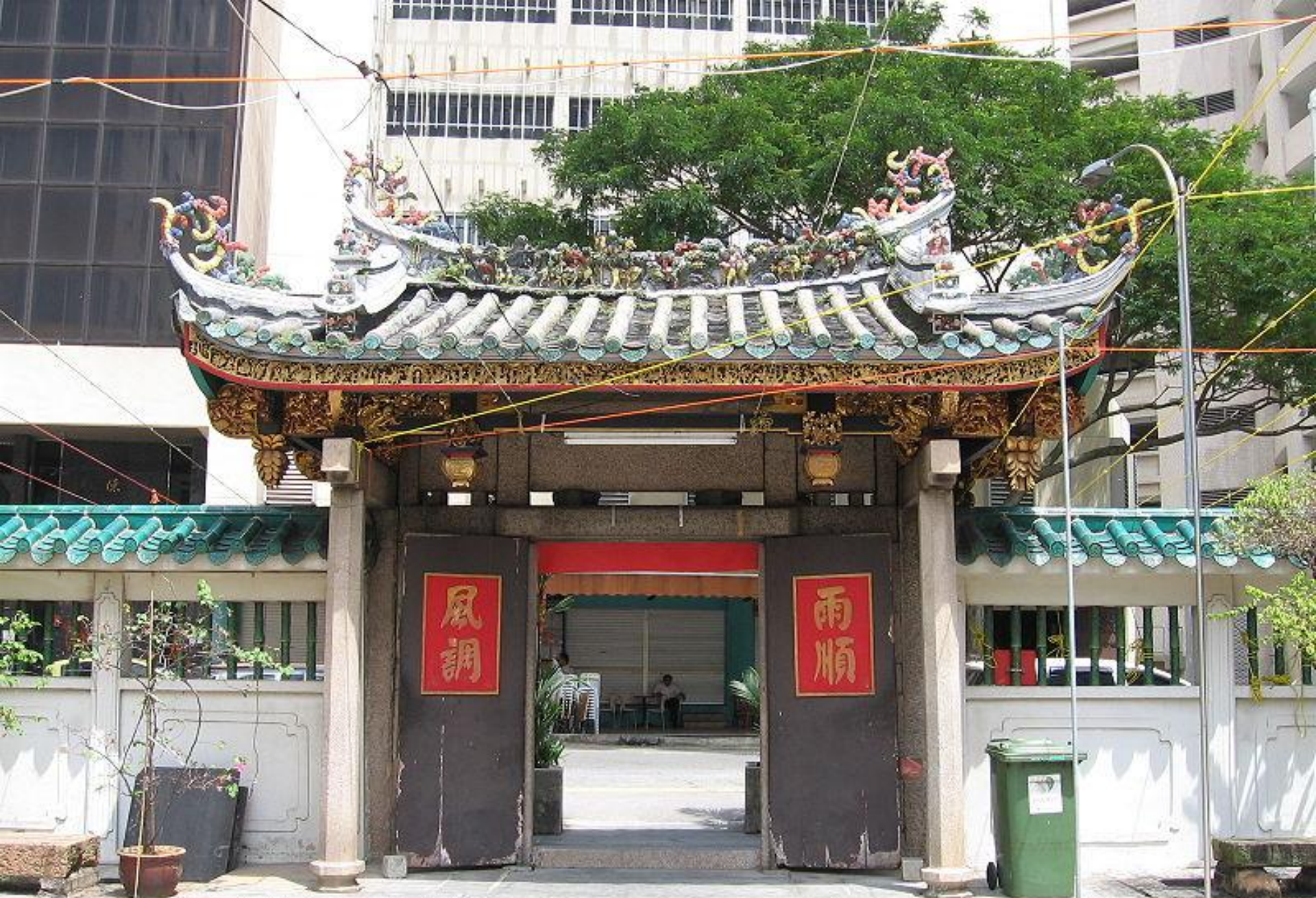
Юэ Хай Цин