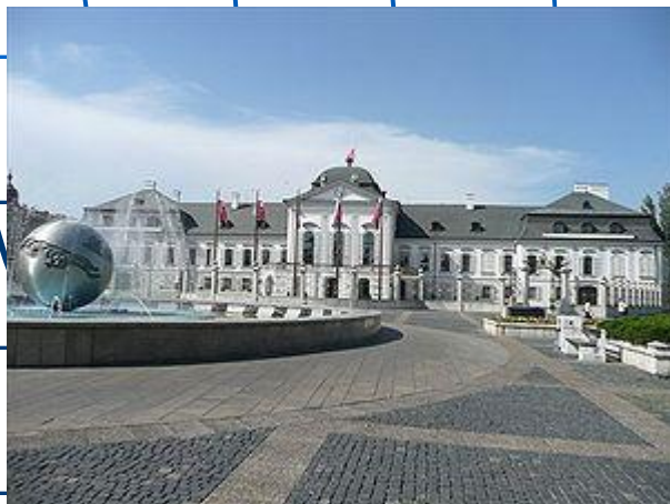
Грасалковичів з канцелярією президента