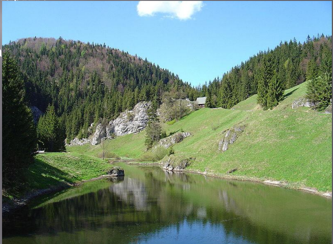
Національний парк Словацький