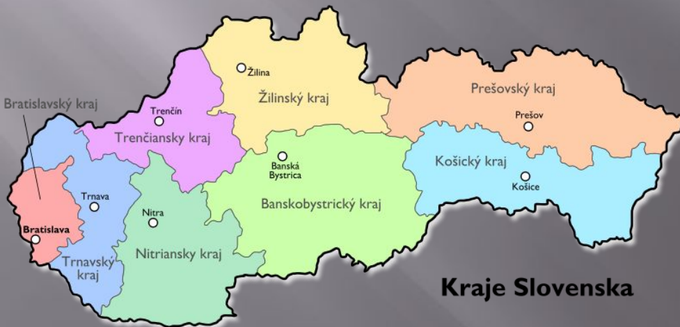
Країни Словаччини Словаччини