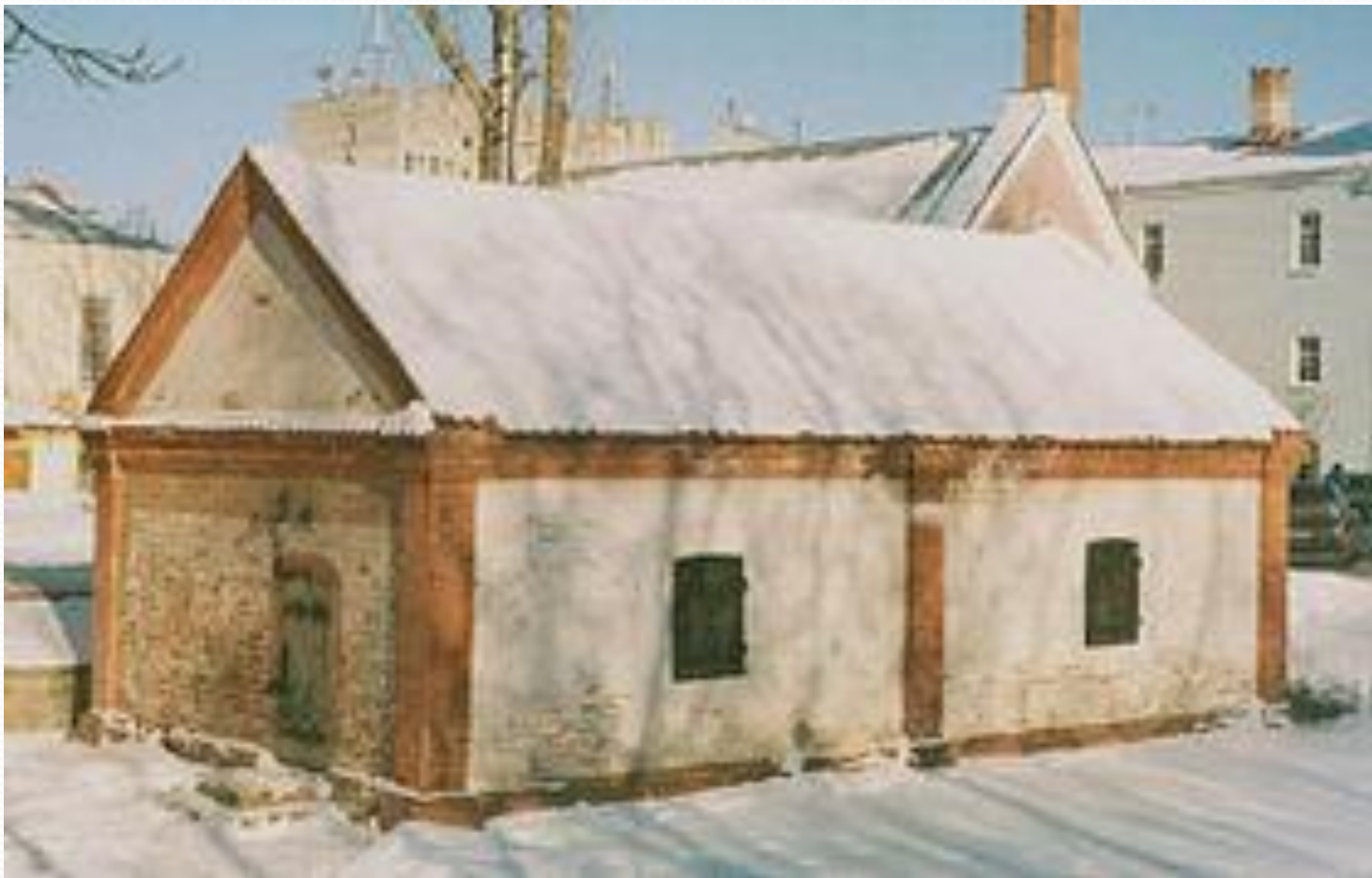
Кузница — самое старое светское здание города Смоленска.