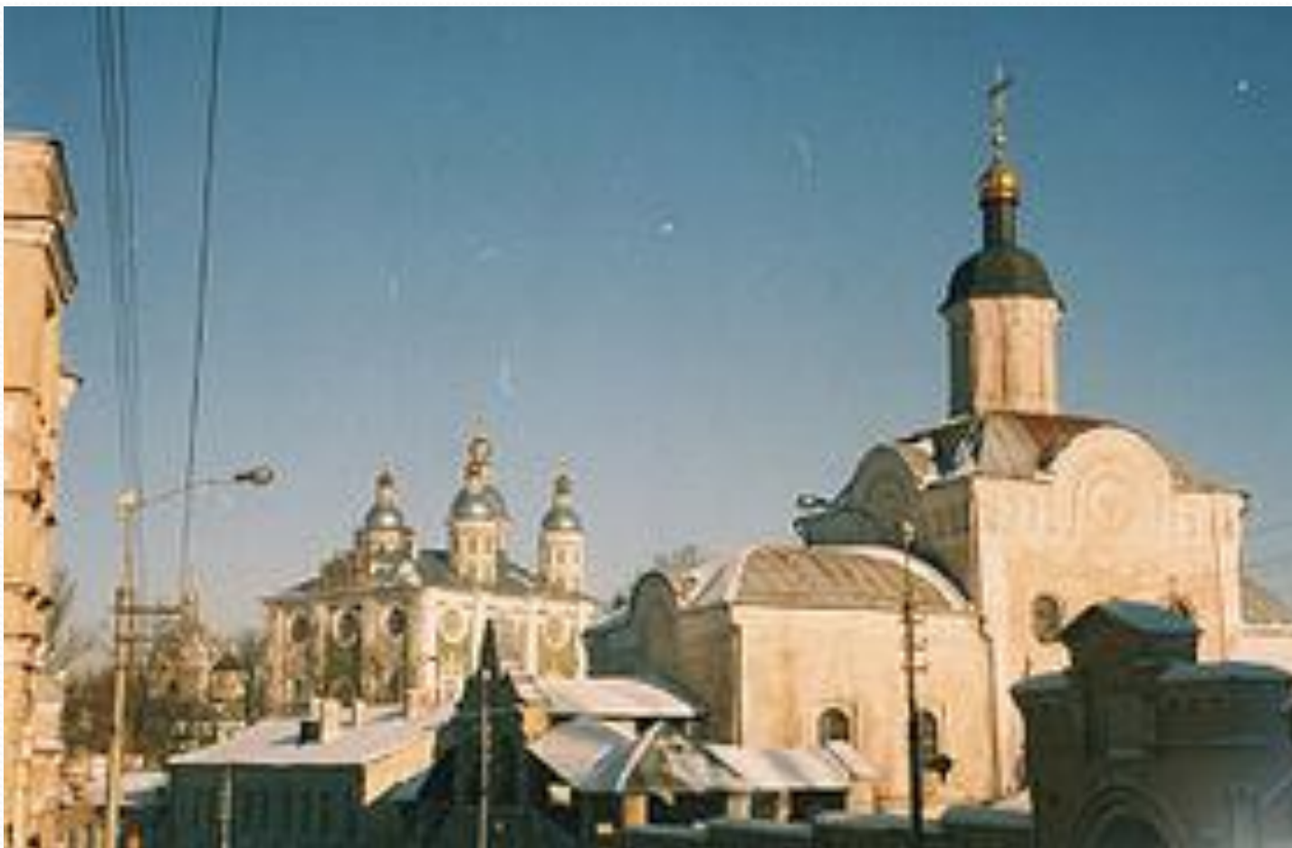
Троицкий монастырь — мужской православный монастырь .