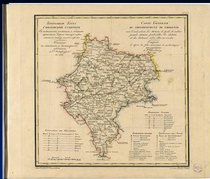
Карта Смоленской губернии