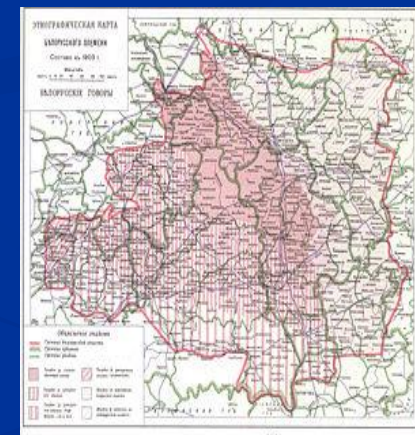
Этнографическая карта 1903 года