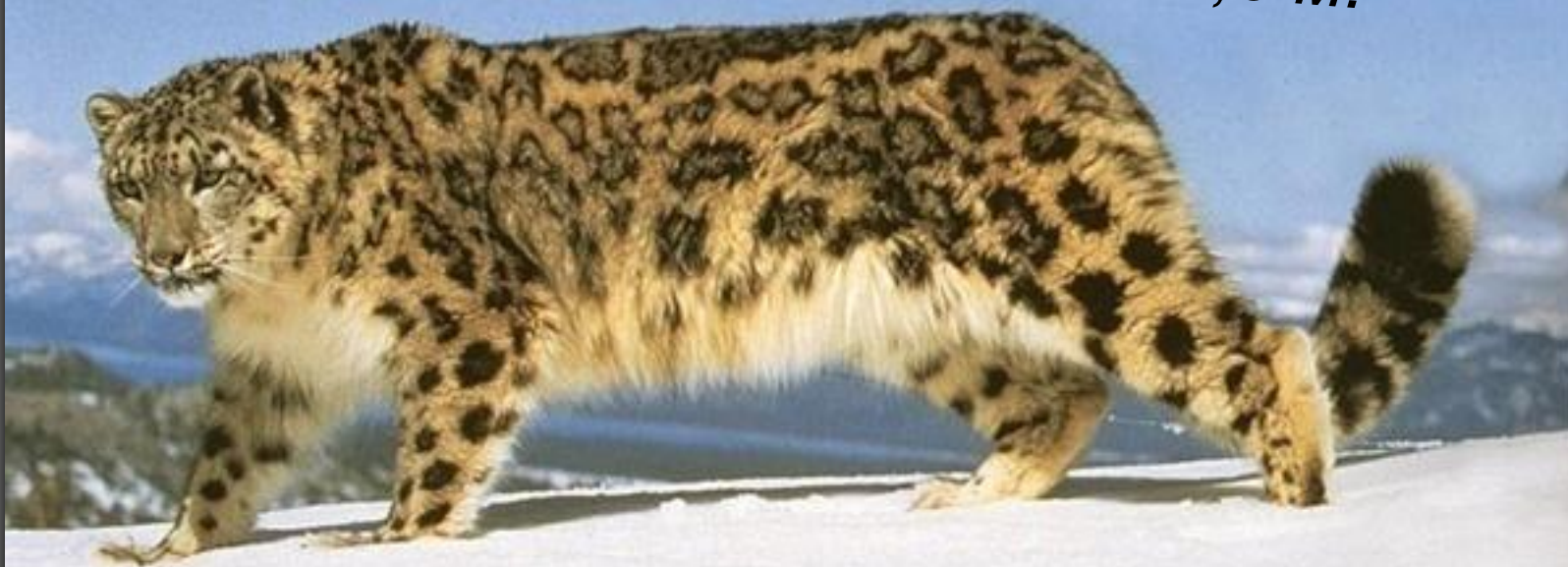
Снежный барс (Ирбис)