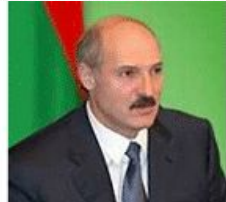
Лукашенко Александр Григорьевич