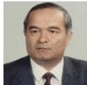
Каримов Ислам Абдуганиевич