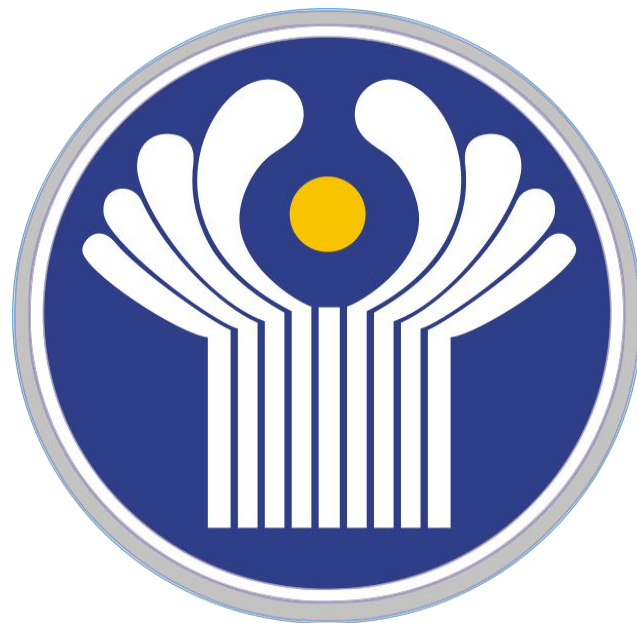
Флаг Содружества Независимых Государств (СНГ)