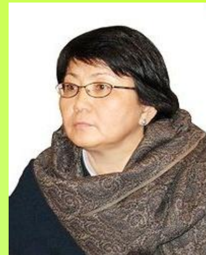
Роза Исаковна Отунбаева

Граничит по суше Казахстан , Китай , Таджикистан , Узбекистан Выход к морям и океанам не имеет