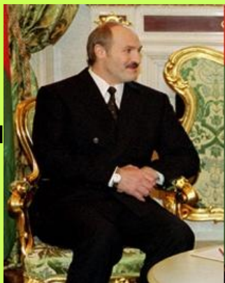
Александр Григорьевич Лукашенко