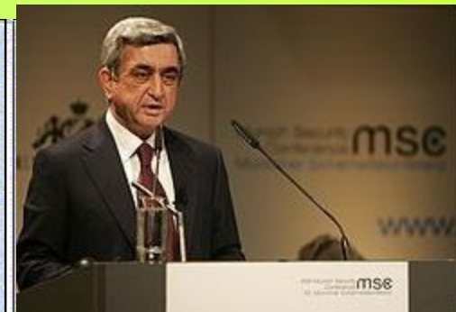
Серж Азатович Саргсян

Площадь : 29 800 км 2 (139 место в мире)