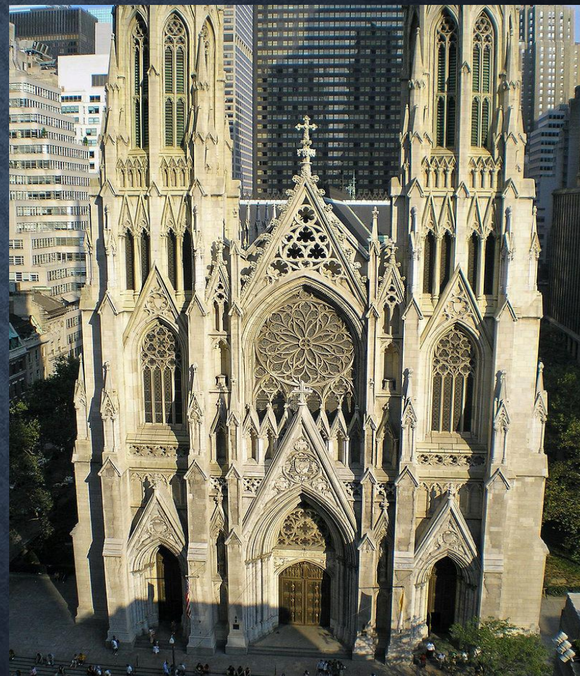
Собор Святого Патрика в Нью-Йорке