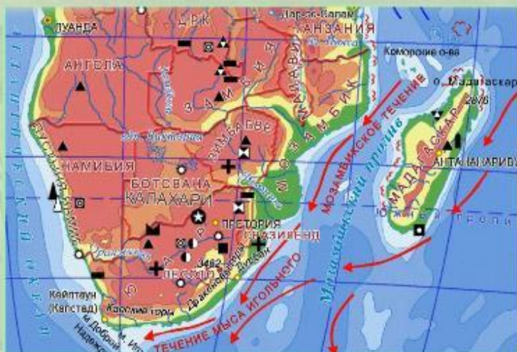
Минеральные ресурсы юга Африки.