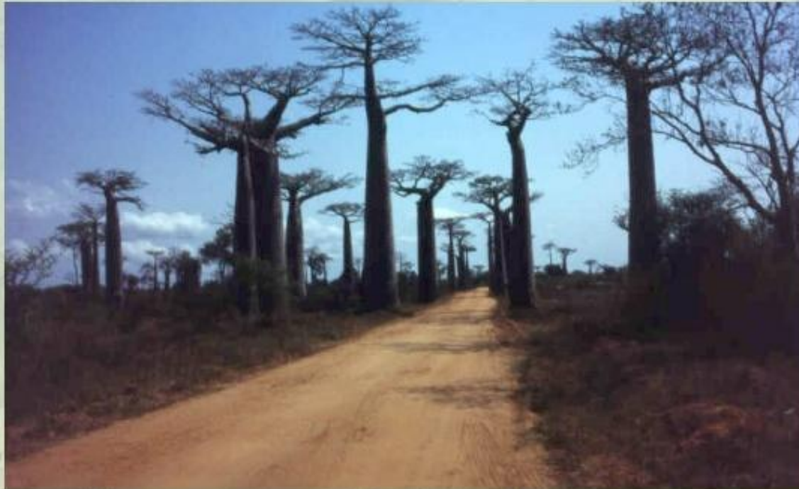
Аллея баобабов на острове Мадагаскар.

Уникальна природа острова Мадагаскар , где представлены африканские, азиатские, южноамериканские, австралийские виды растений и животных. Кроме того, здесь встречаются и виды- эндемики , обитающие только на этом острове.