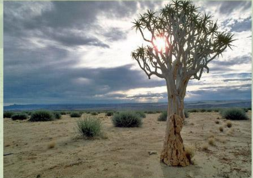
Алоэ в пустыне Калахари.

На юге материка располагаются разрушенные Капские горы , а на юго-востоке - плосковершинные разрушенные Драконовы горы . На востоке лежит низменная прибрежная Мозамбикская равнина, в центре - котловина, которую занимает пустыня Калахари , а на западном побережье - пустыня Намиб.