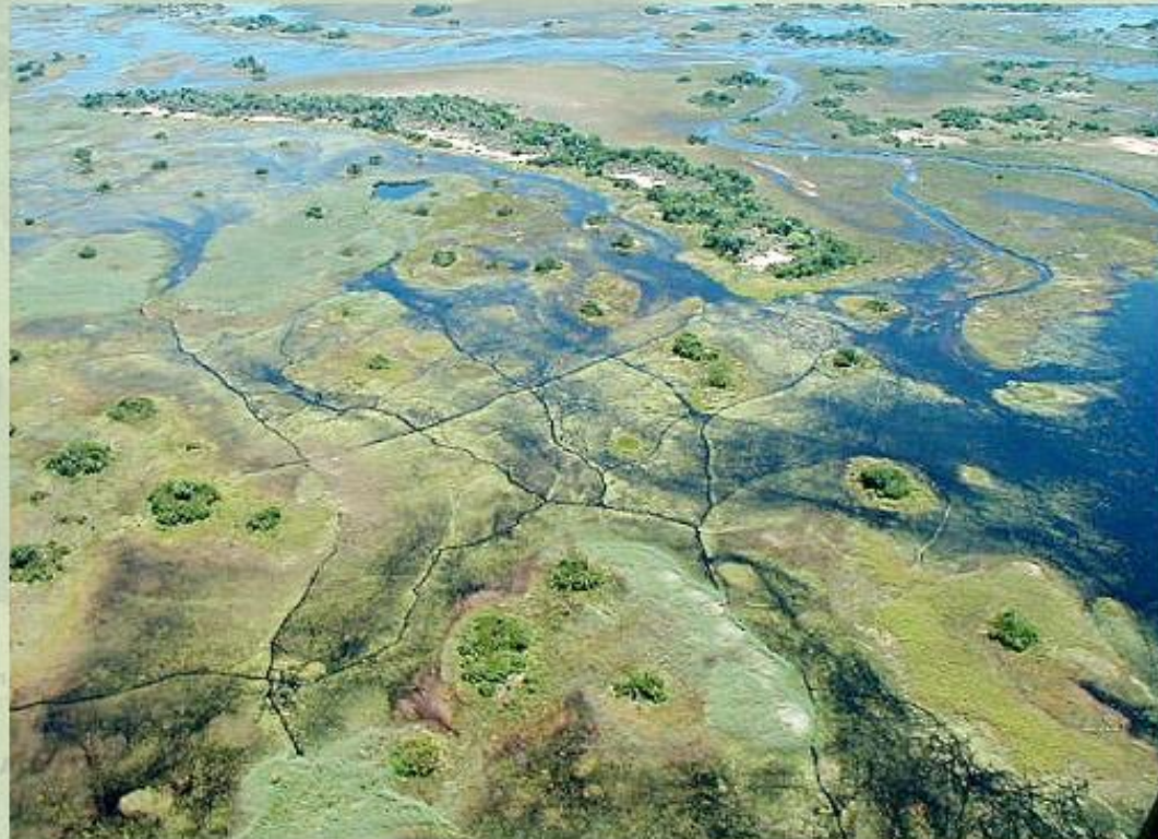
Дельта реки Окаванго.

Заболоченная дельта реки Окаванго (Ботсвана) граничит на востоке с влажными тропическими лесами.