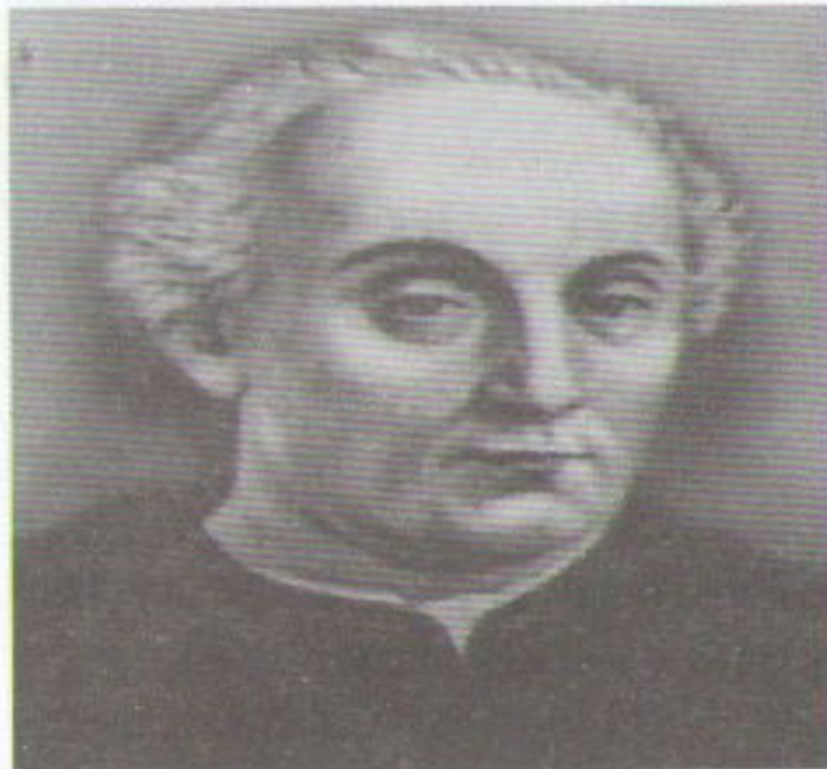
Христофор Колумб (1451–1506)

1492 жылы Х. Колумб бастаған испан экспедициясының материктің оңтүстік жағалауларын ашқанын білесіңдер. Олардан көбұрын, X ғасырдың аяғында Исландия жағалауы арқылы Гренландия жағалауына жеткен нормандар солтүстіктің қатаң климат жағдайында бірнеше жүз жыл бойы аралдың оңтүстігі мен оңтүстік-шығыс жағалауында тұрған. Кейінірек олар Лабрадор түбегінің солтүстік-шығыс жағалауына дейін жеткен. Кейіннен XV ғасырдың аяғында ағылшын қызметіндегі италиялы Джон Кабот Ньюфаундленд арал мен Лабрадор түбегі жағалауын ашты. Ал 1519 жылы Эрнан Корт бастаған испандардың жорығы ацтектер мемлекеті орналасқан қазіргі Мексика жерін басып алумен аяқталды