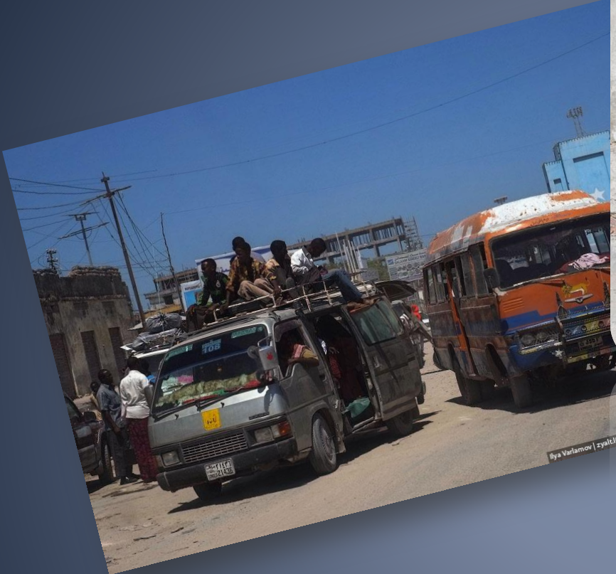
Ilya Varlamov | zyalivejournal.com | 28-300.ru Photo Agency