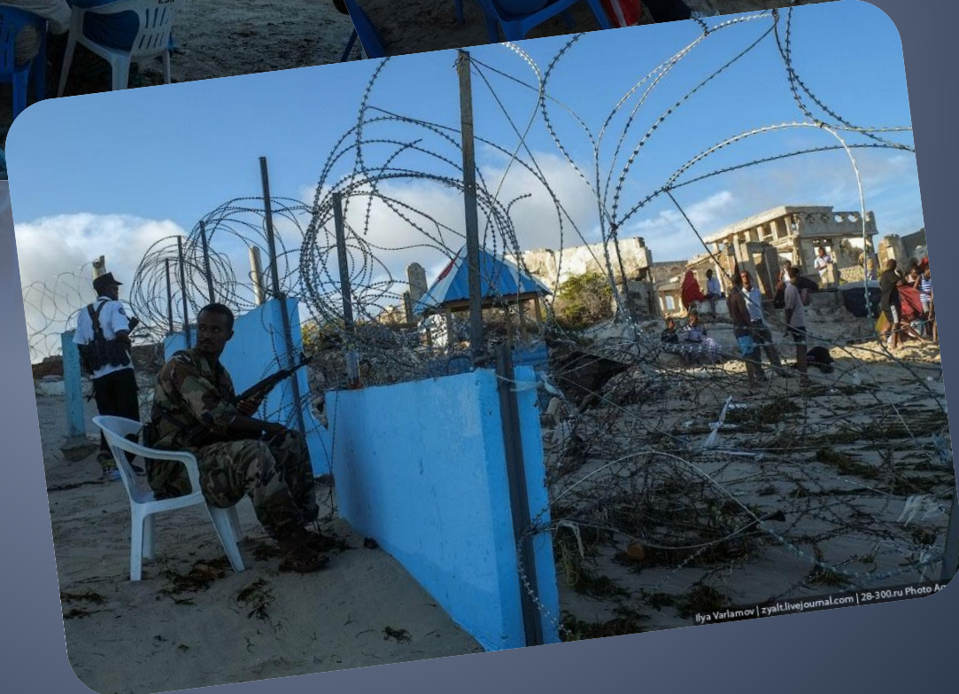
Ilya Varlamov | zvalivejournal.com | 28-300.ru Photo A