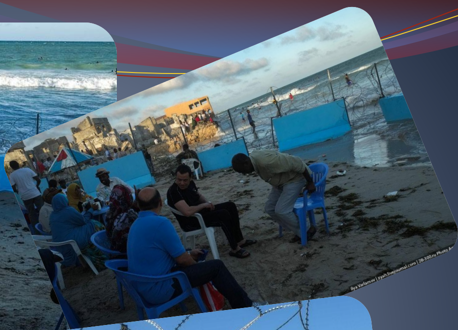
Photo A