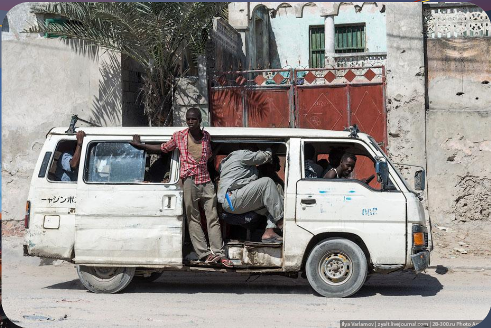
Ilya Varlamov | zyalivejournal.com | 28-300.ru Photo Agency