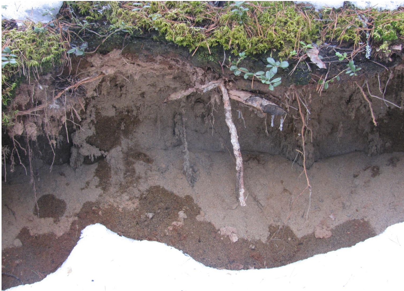
Почвы дерново-подзолистые на морене.