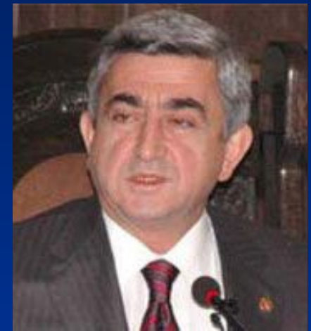
Саргсян Серж Азатович