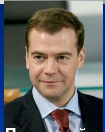
Дмитрий Анатольевич Медведев