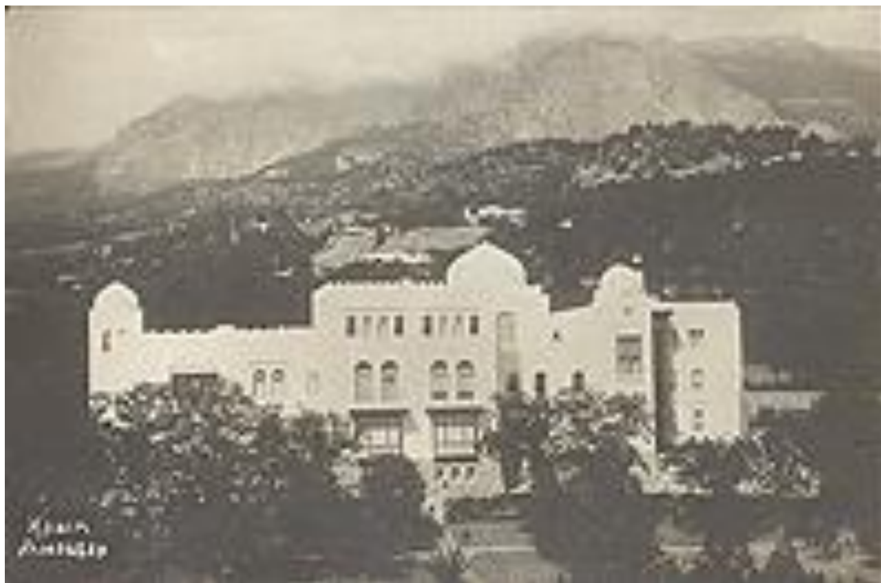
База отдыха ОПТЭ