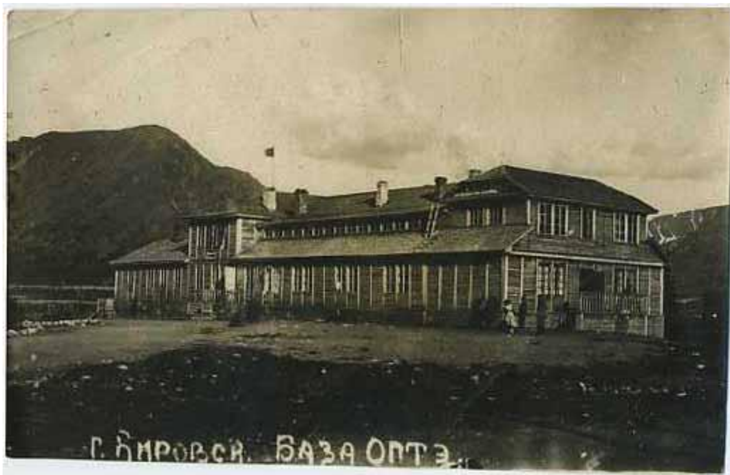
База отдыха ОПТЭ