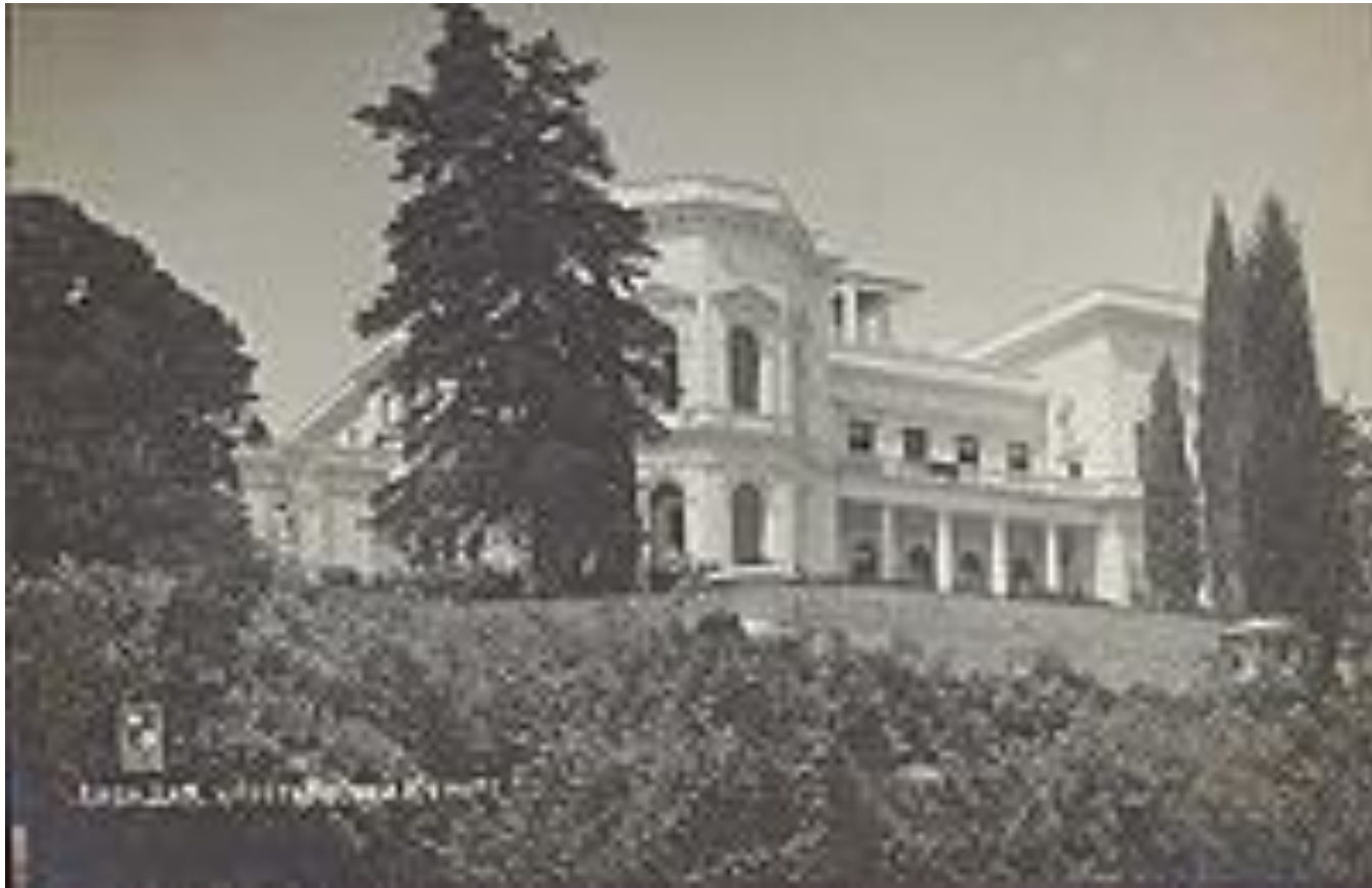
База отдыха ОПТЭ