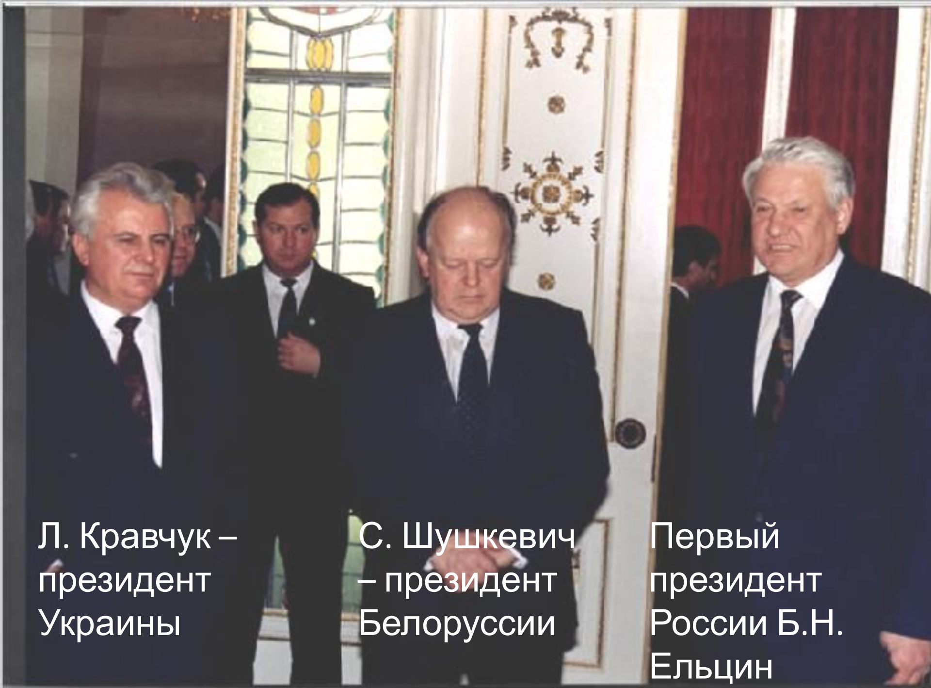
Л. Кравчук – президент Украины