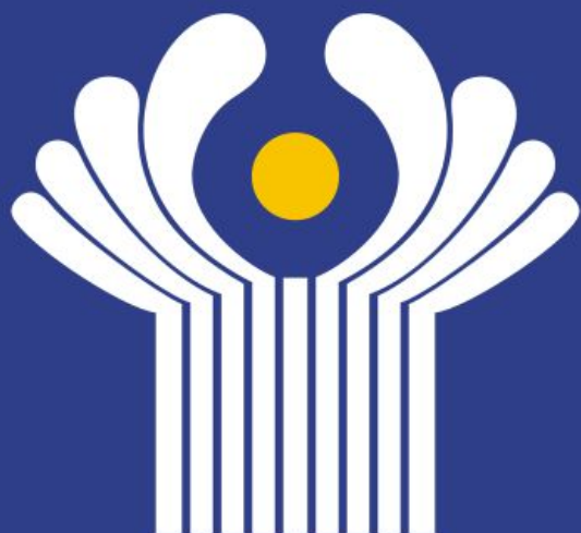
Флаг Содружества Независимых Государств