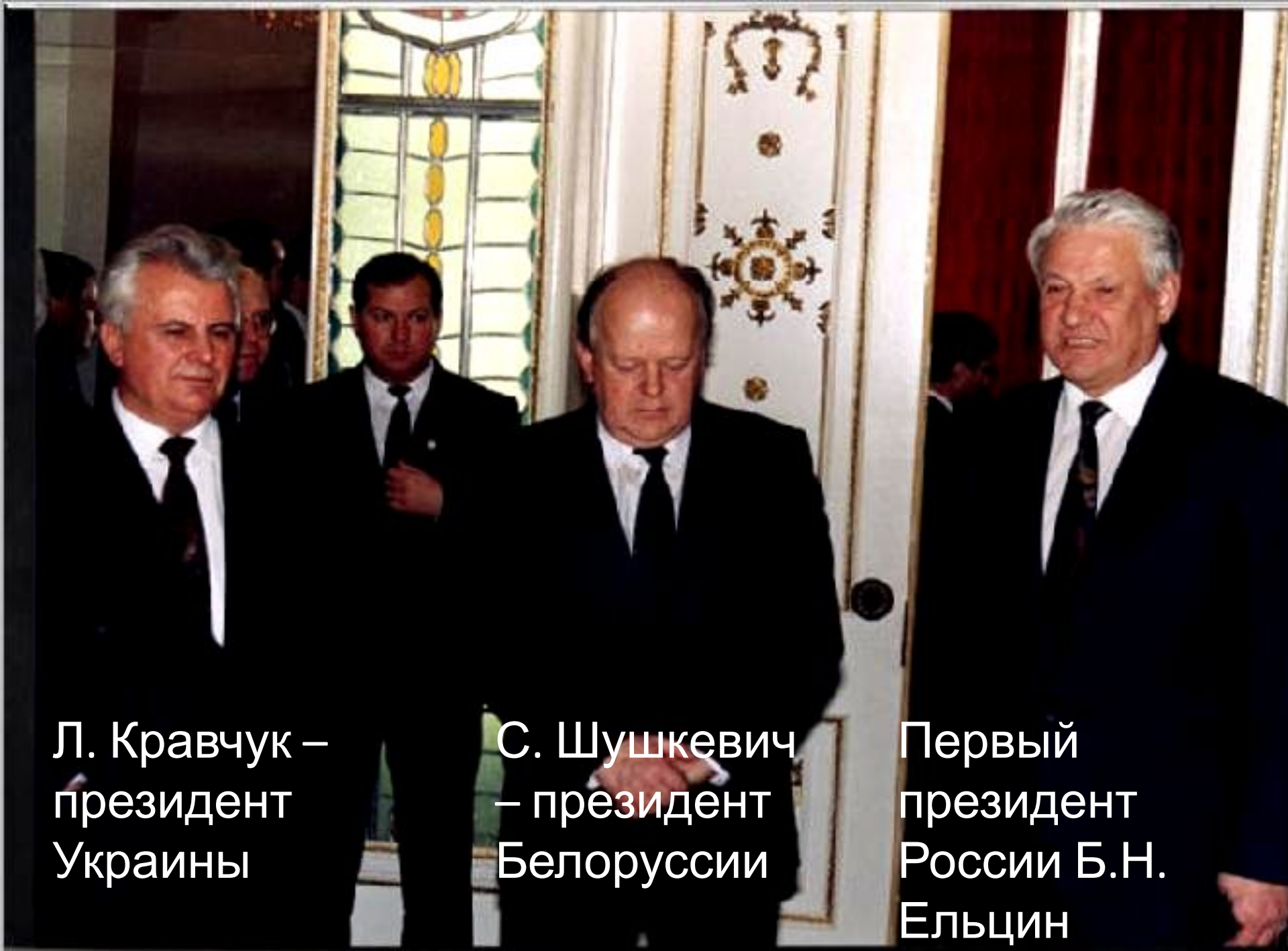
Л. Кравчук – президент Украины