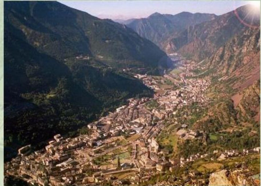
Андорра - небольшое государство в Пиренеях.