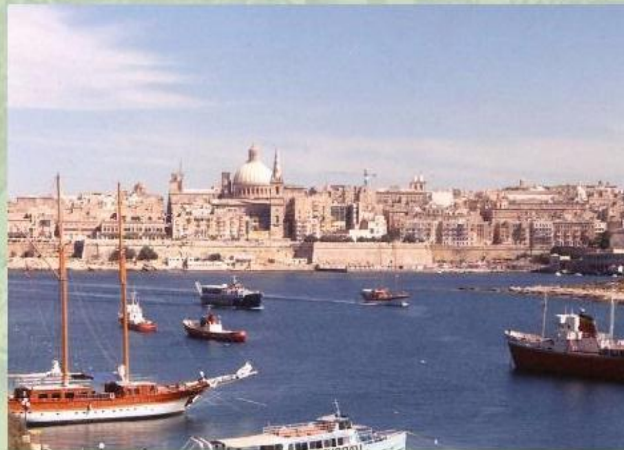
Мальта - «остров-памятник».