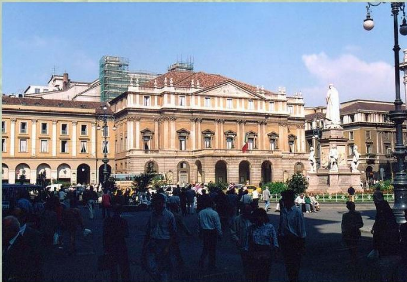
Миланский оперный театр - Ла Скала.