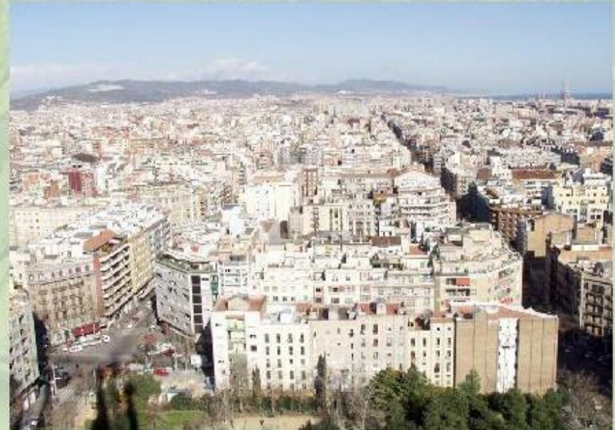
Барселона - крупнейший город Испании.

Многомиллионный Мадрид - столица страны - город дворцов и музеев, важнейший промышленный центр страны.