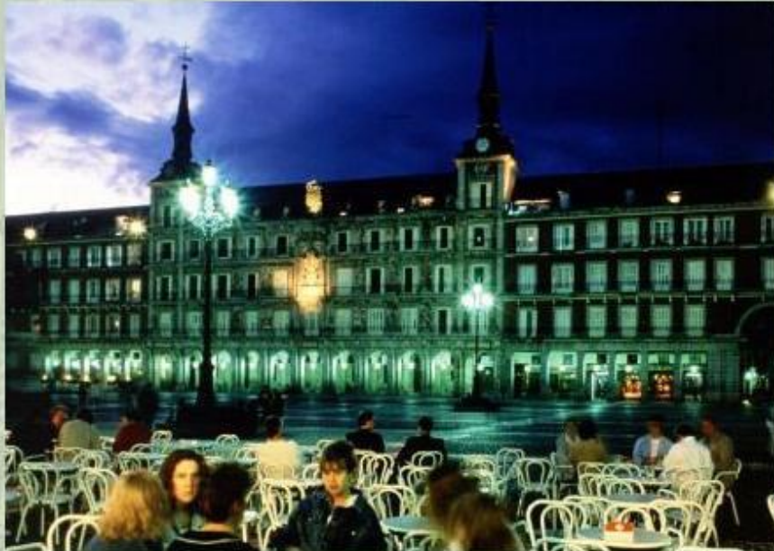
Мадрид - столица Испании.