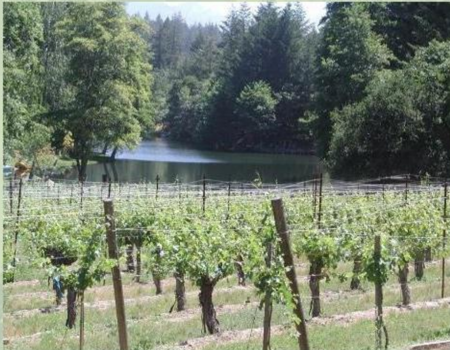
Виноградники в Средиземноморье.

Плодородные земли Паданской равнины в Италии заняты посевами зерновых и овощей. Здесь растут также плодовые деревья и виноградники. На юге страны выращивают маслины и цитрусовые. Италия - мировой экспортер фруктов, вин и оливкового масла.