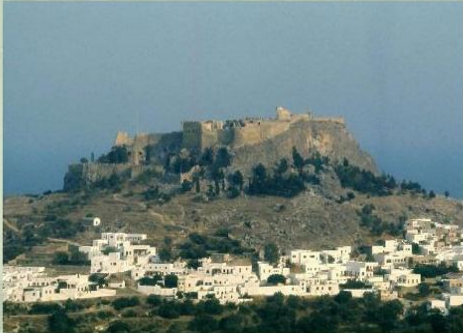
Греция - родина древних мифов.