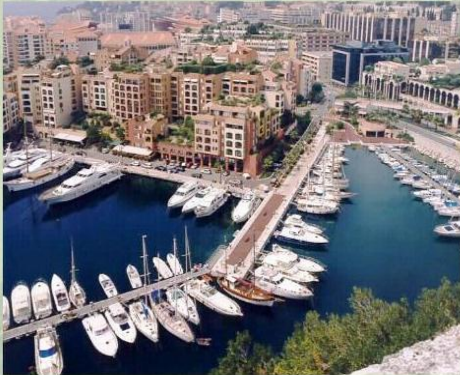
Гавань в Монако.