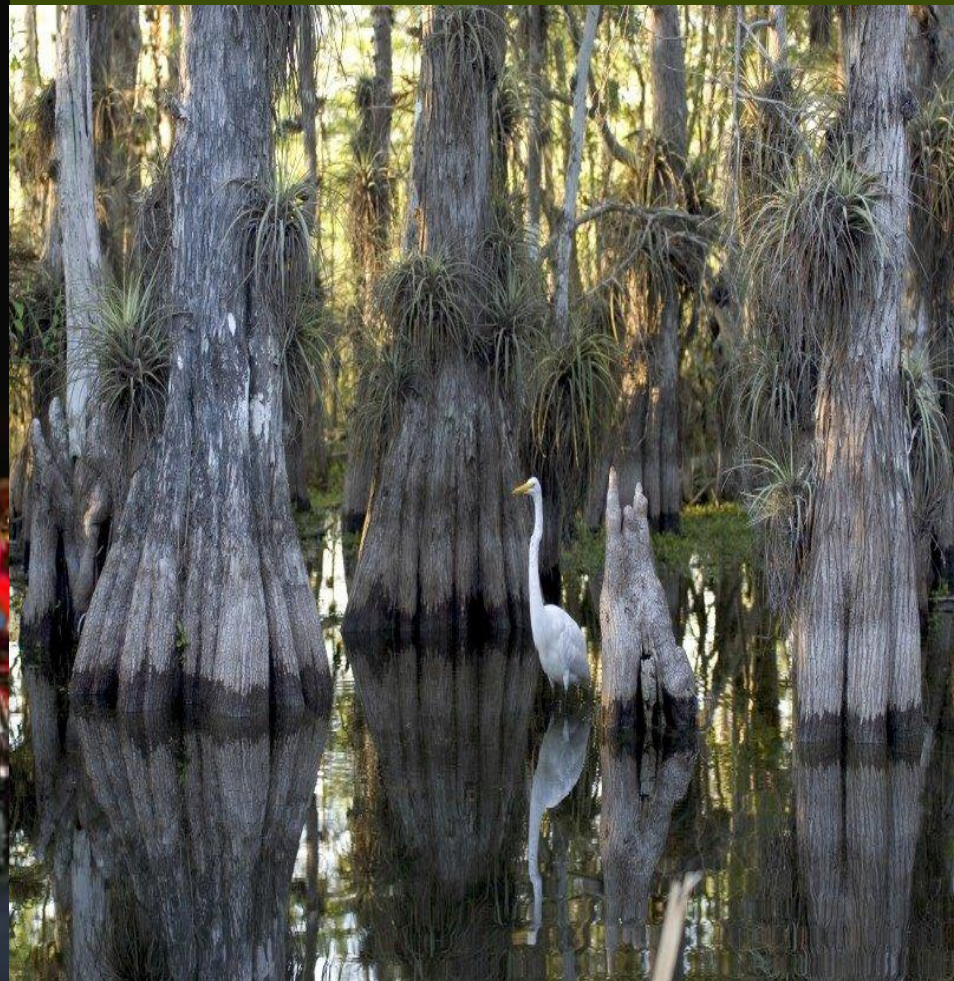
Национальный заповедник Эверглейдс