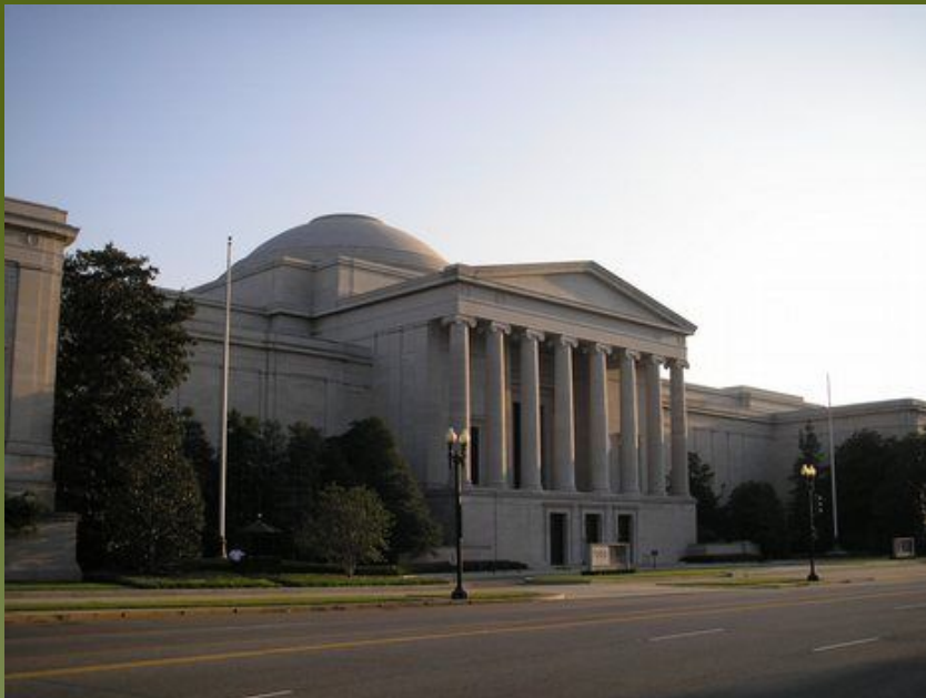
Национальная галерея искусств