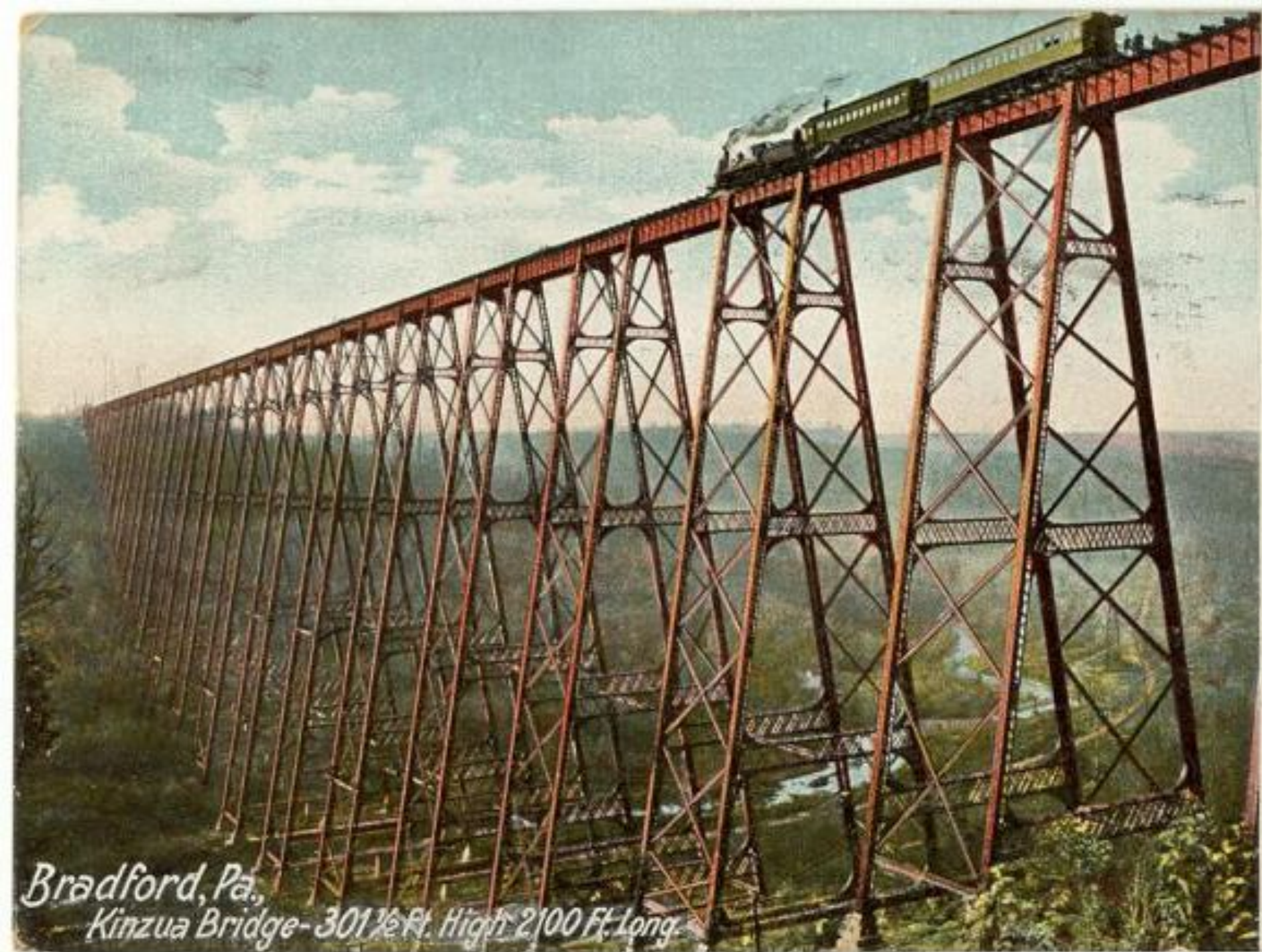
Bradford, Pa. Kinzua Bridge - 301 1/2 Ft. High 2100 Ft. Long