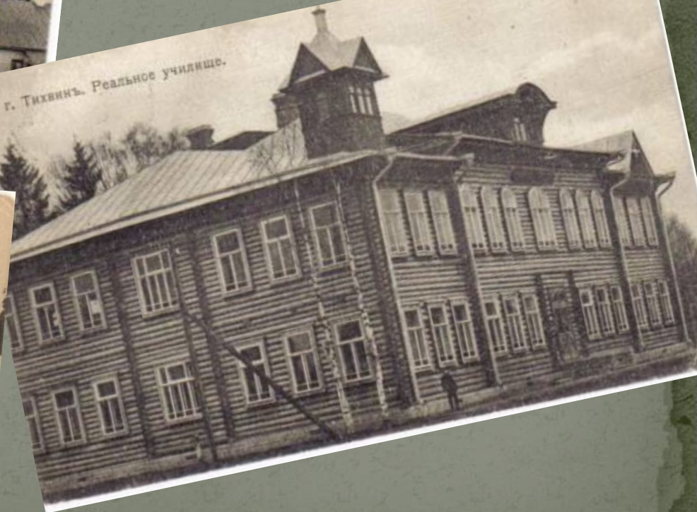
г. Тихвинъ. Реальное училище.