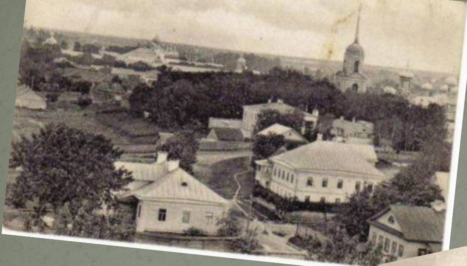
г. Тихвинъ. Реальное училище.