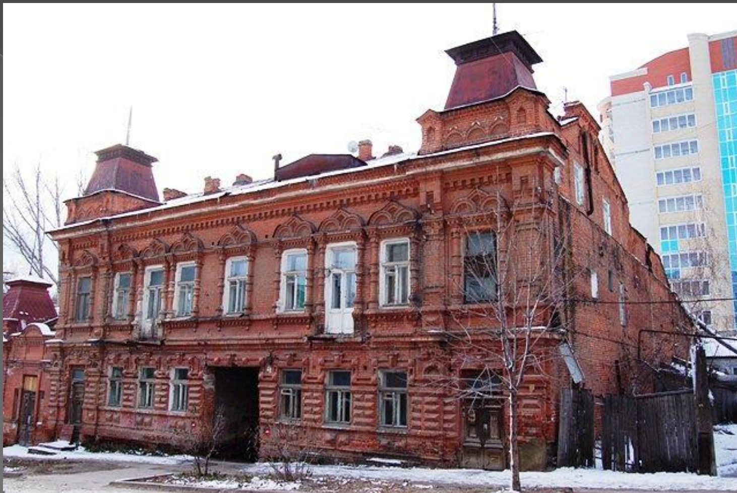
Ул. Соборная. Доходный дом