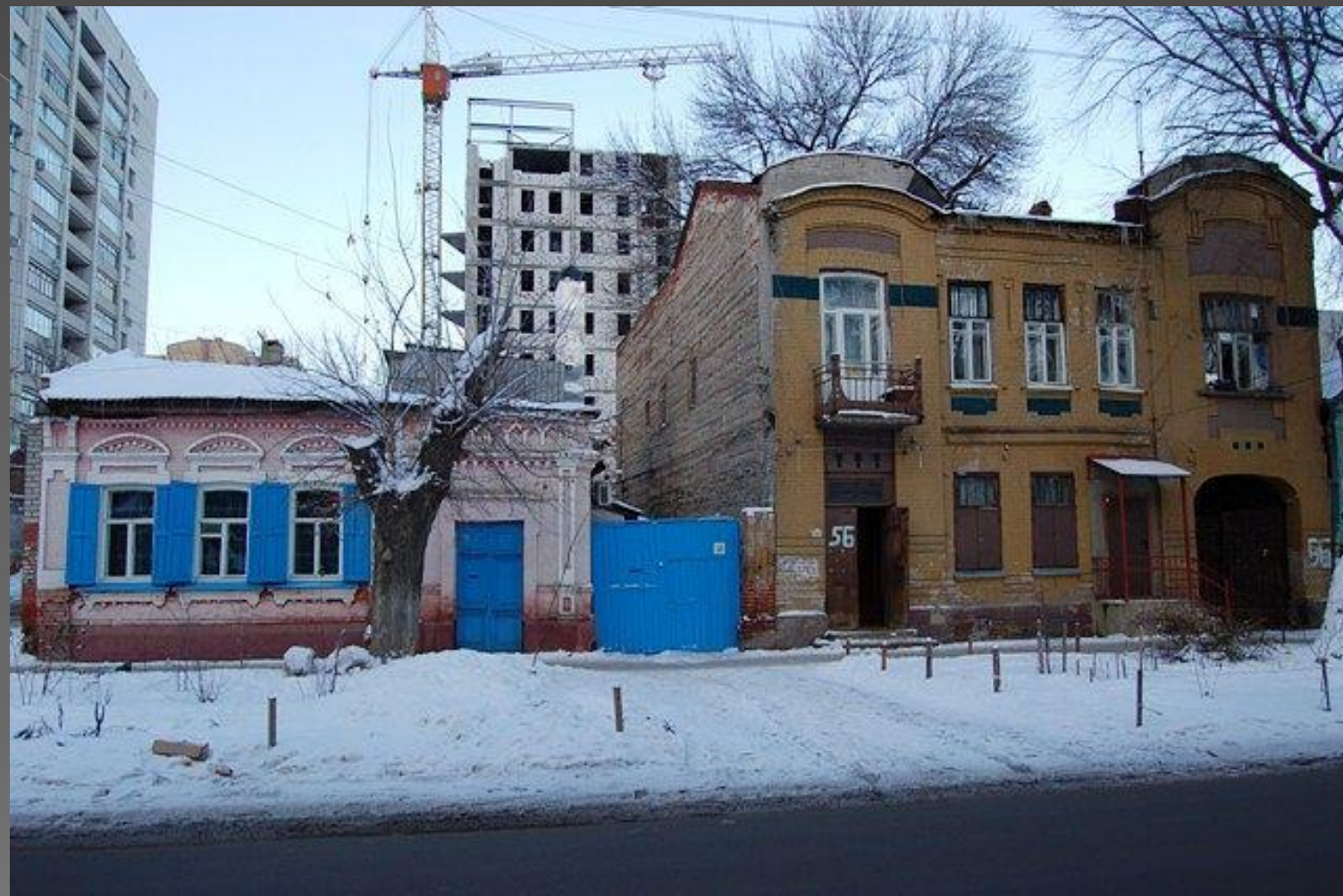
Ул. Царицынская (Киселёва). Начало XIX века.