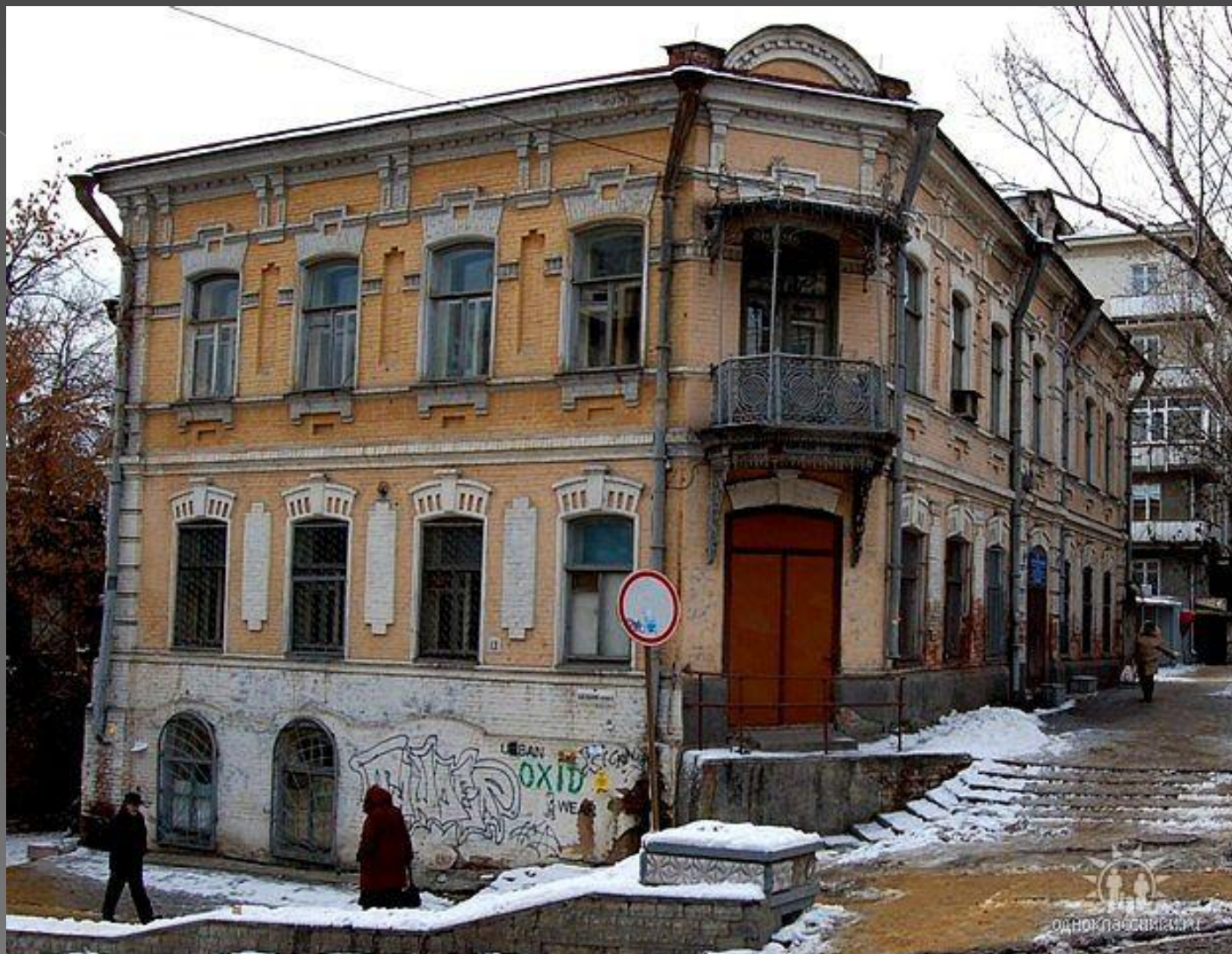
Ул. Бабушкин взвоз. Доходный дом. Конец XIX века.