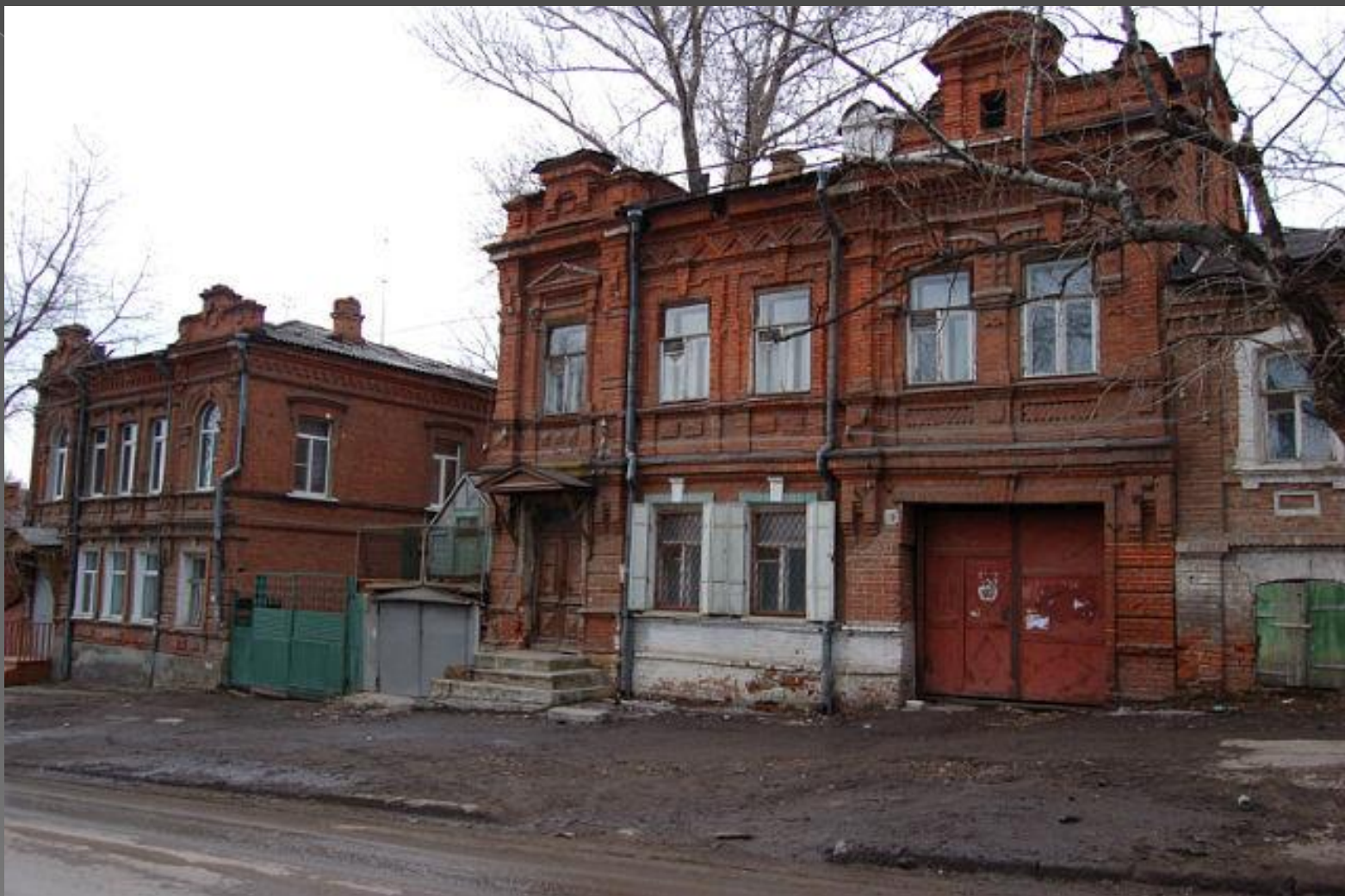
Ул. Симбирская. Начало XIX века. Жилой дом.