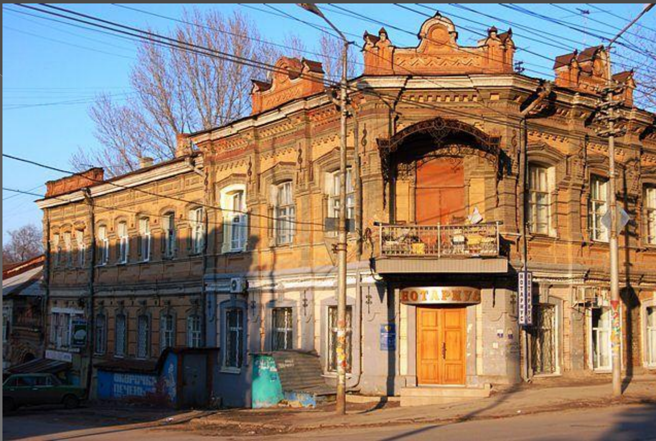
Угол ул. Цыганской (Кутякова) и Мясницкой. Купеческий дом. XIX век.