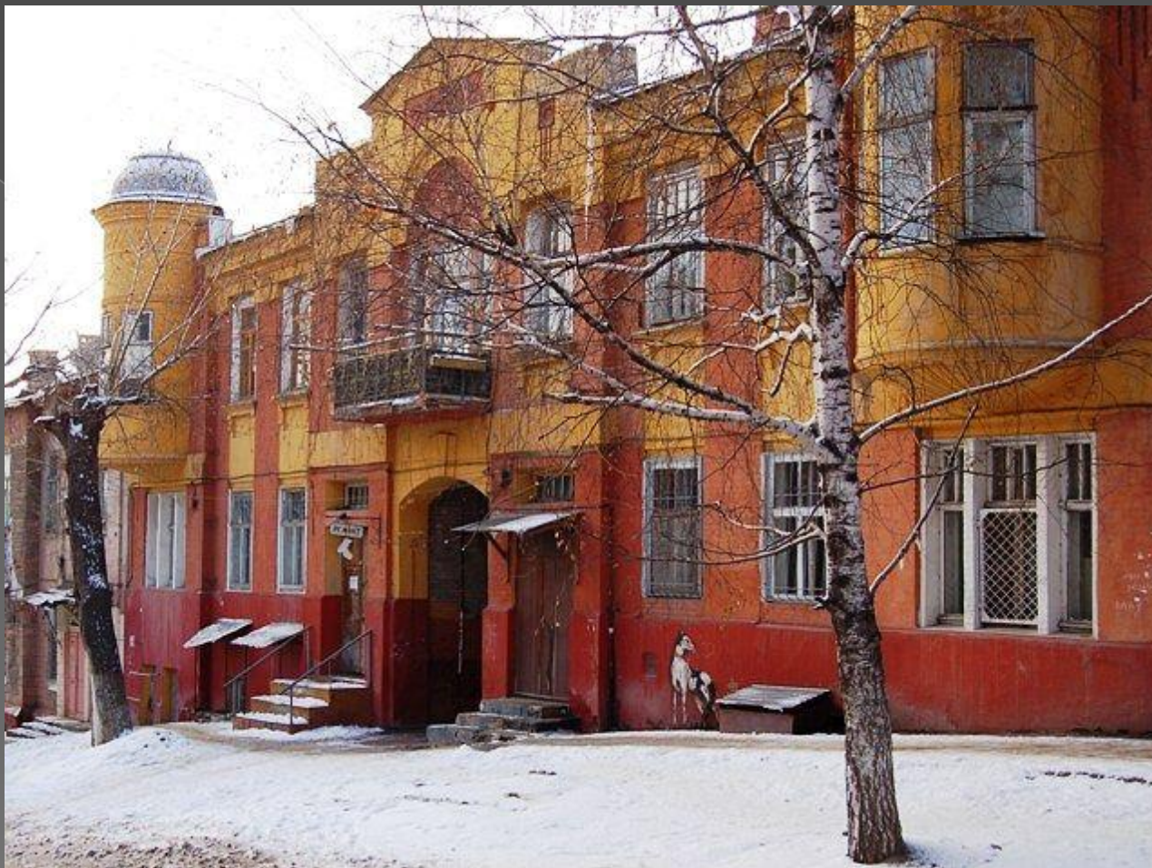
Ул. Провиантская. Гостиница. Конец XIX века.