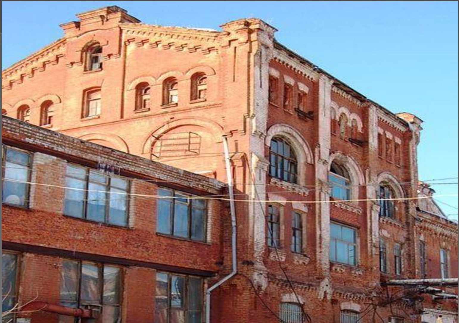
Ул. Казарменная (Университетская). Спиртзавод. Конец XIX века.