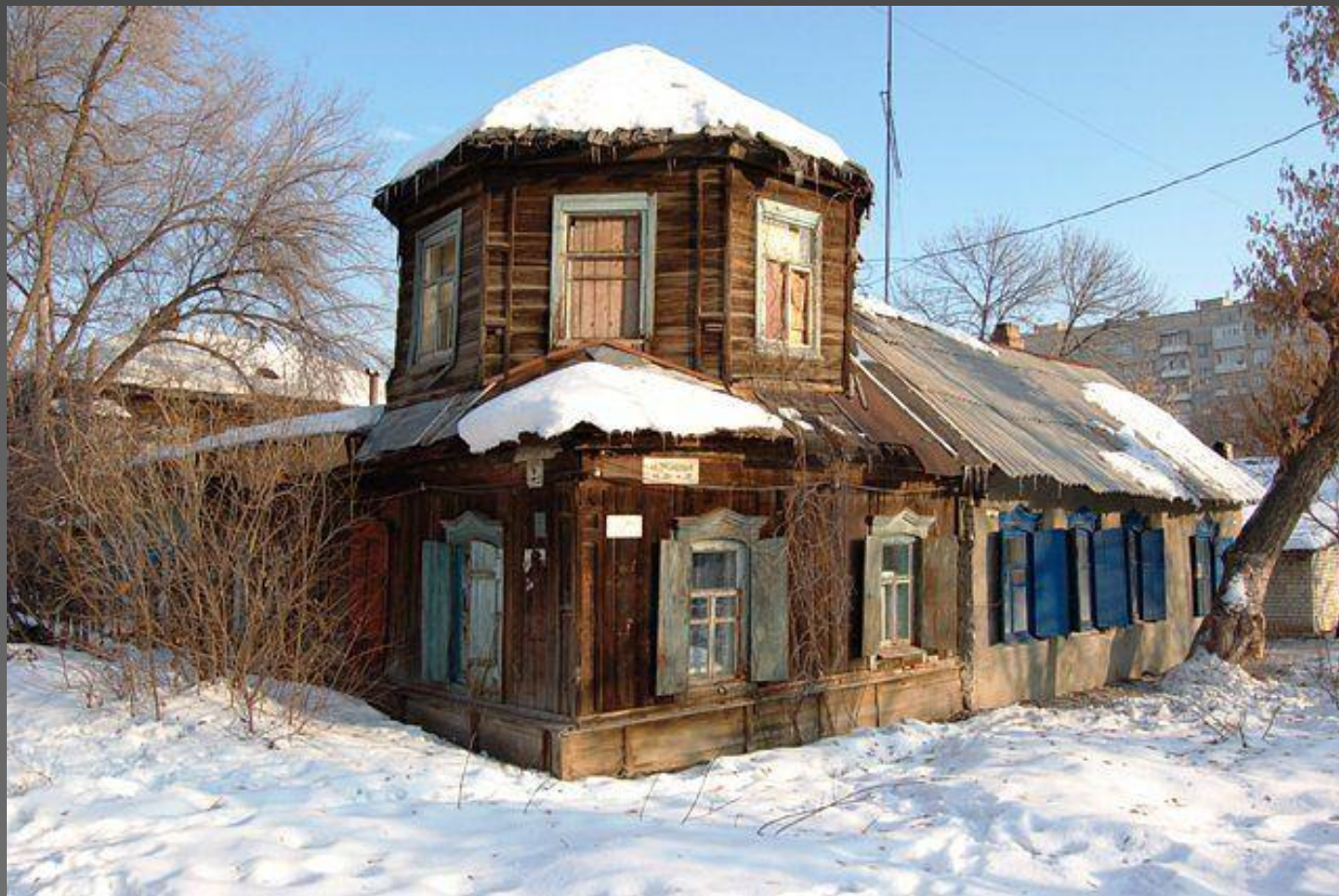
Ул. Царёвская (2 Садовая). Начало XIX века.