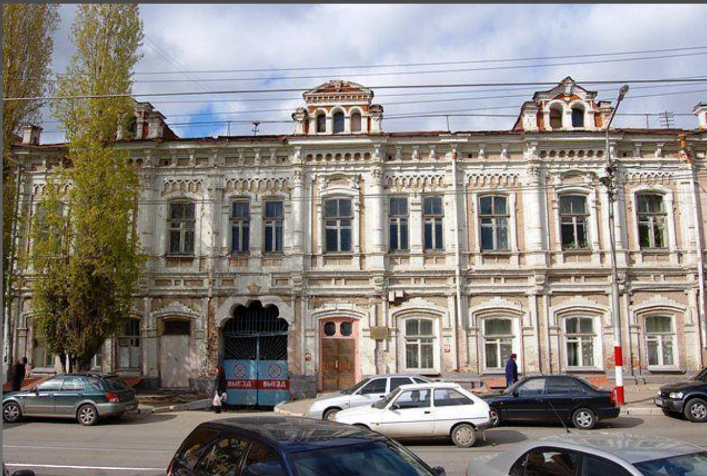
Ул. Цыганская (Кутякова). Гостиница Верхнего базара. XIX век.