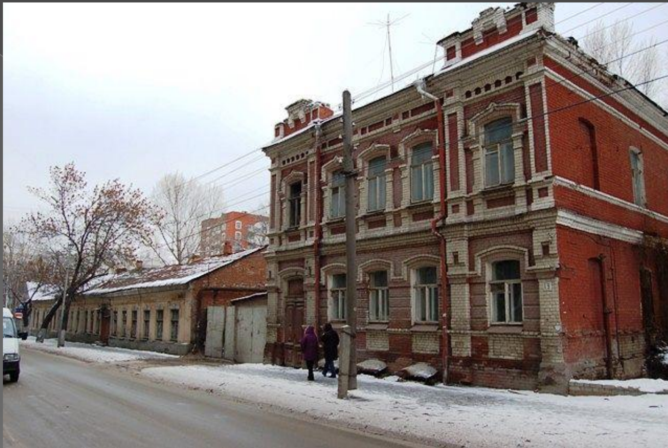
Ул. Часовенная (Челюскинцев). Жилой дом. XIX век.