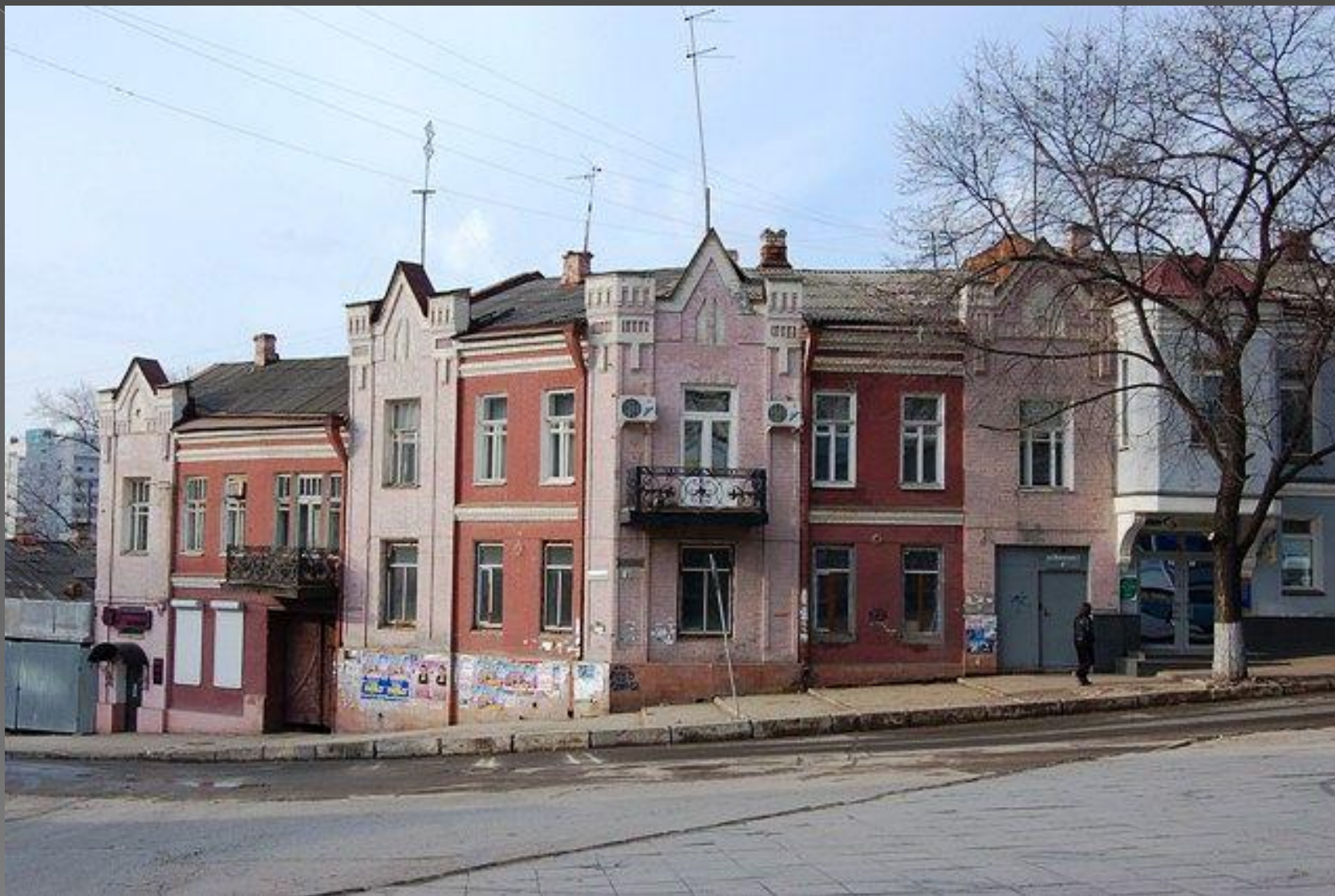
ул. Армянская (Волжская).