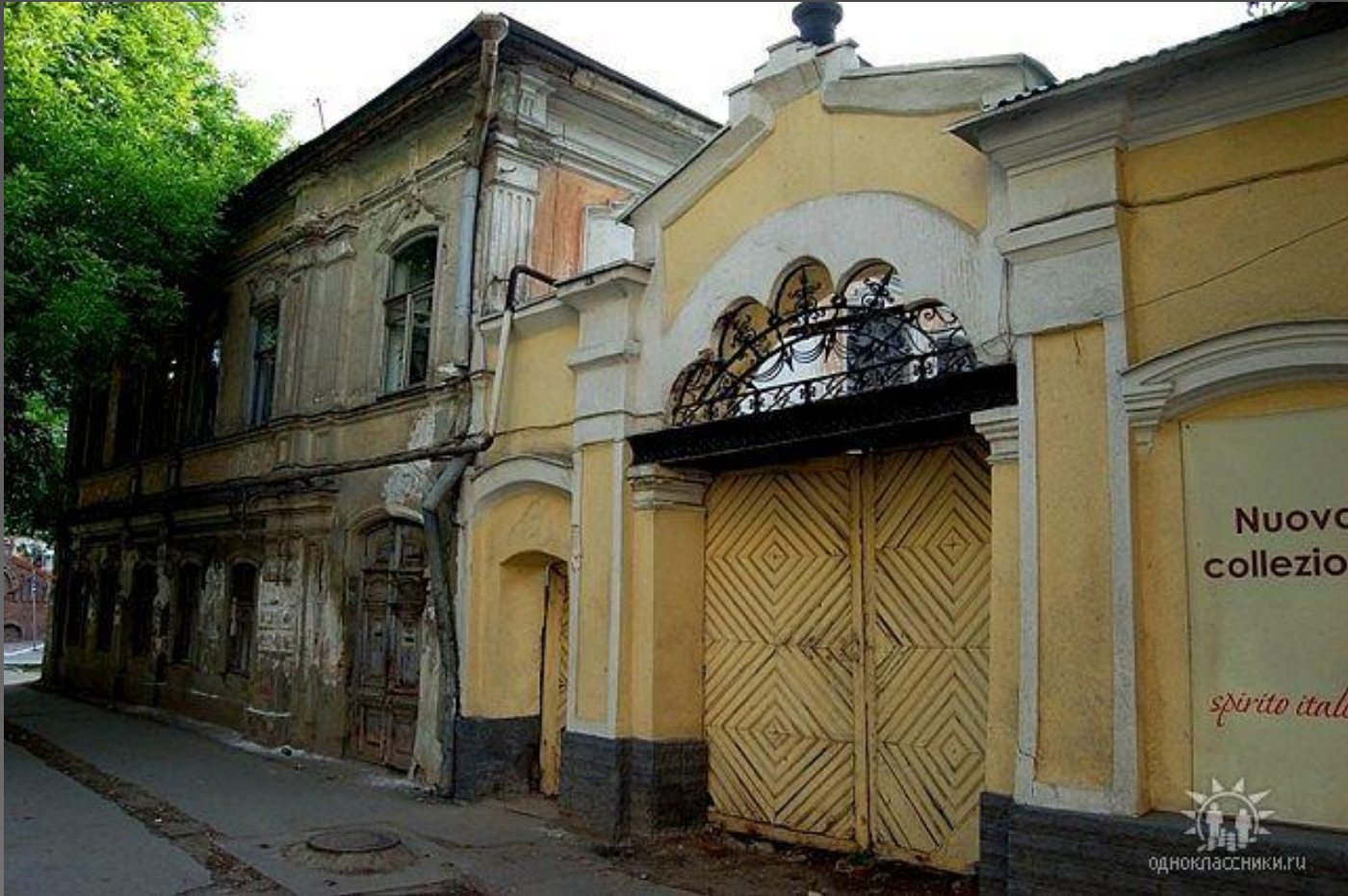
Ул. Ильинская (Чапаева). Усадьба Мордвинкиных. Начало XIX века.