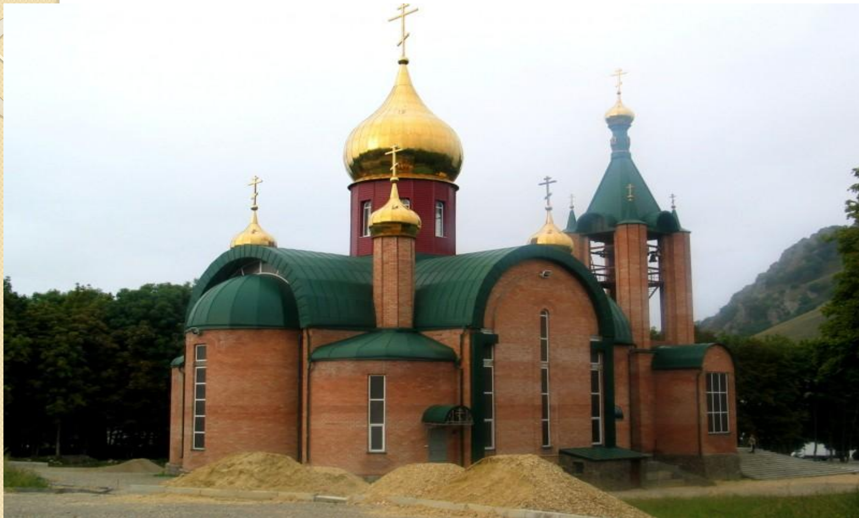
Храм Сергия Радонежского