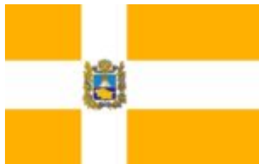
Флаг Ставропольского края