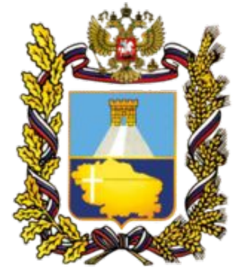
Герб Ставропольского края