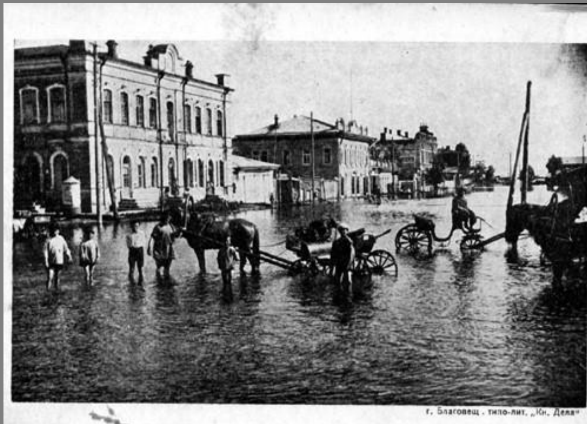
г. Благовещ . типо-лит. „Юн. Деля“