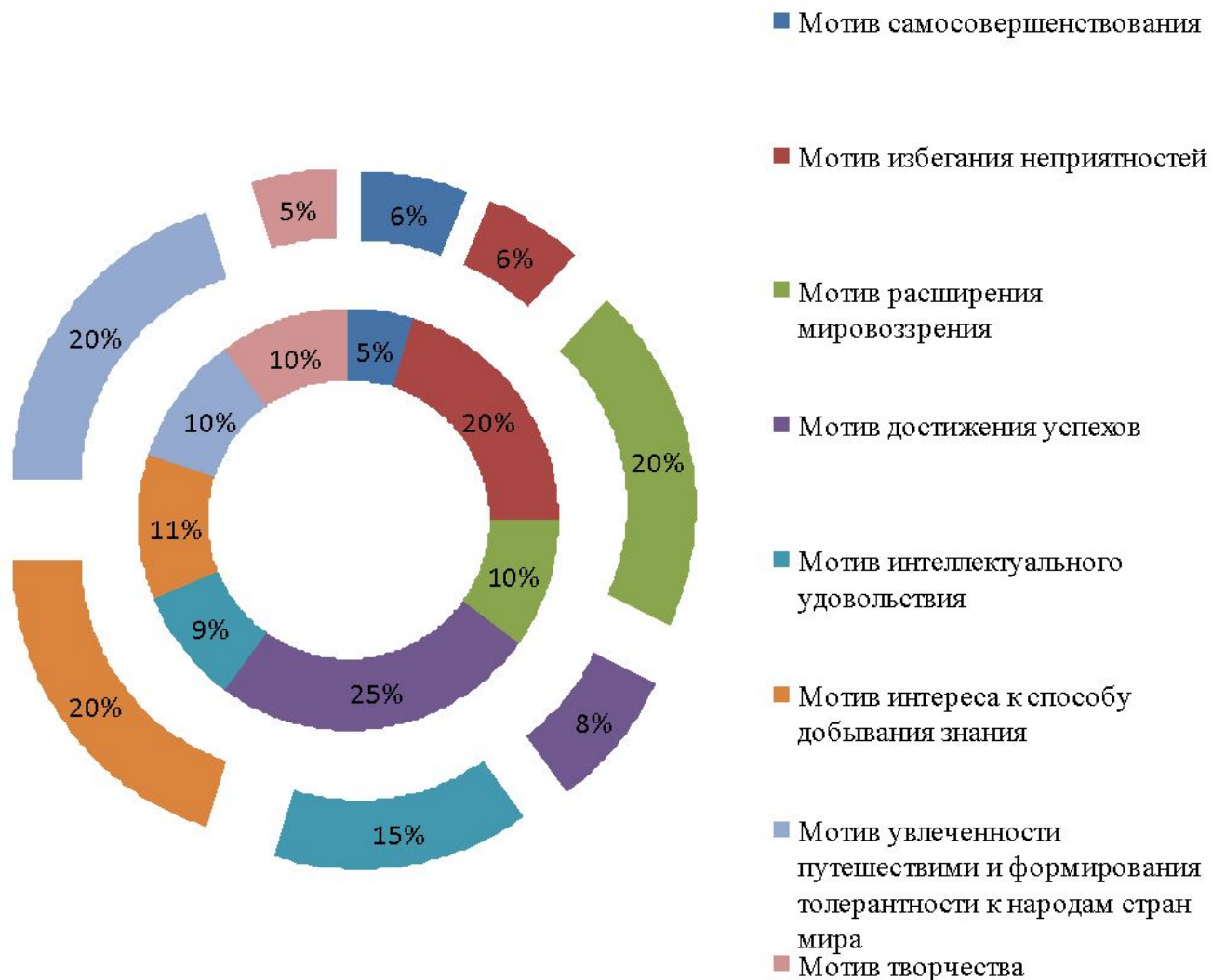
Рисунок 3.1. - Развитие мотивов и интересов в экспериментальном классе до и после эксперимента