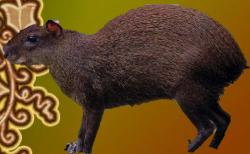
Золотистый заяц агути