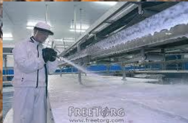
Индустриальные моющие средства