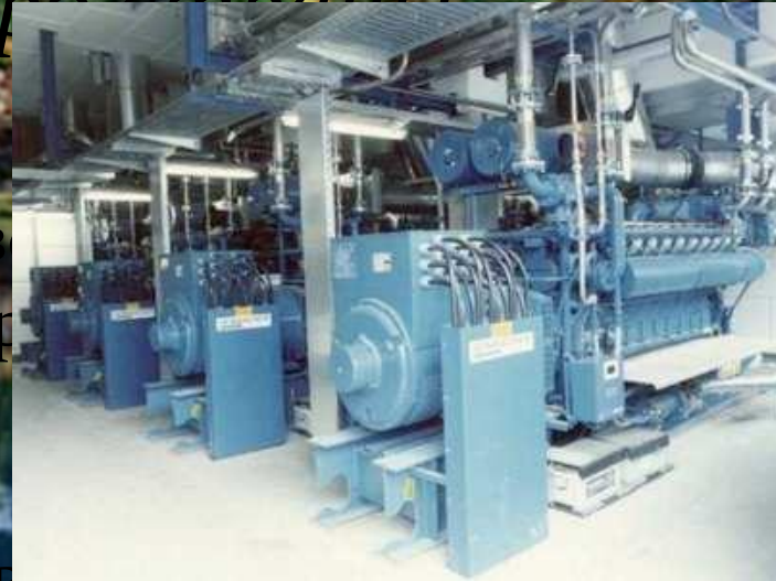
Хим. завод в Австрии

Официальное название – Республика Австрия. В Австралии практически нет природных ресурсов, поэтому страна зависит от импортируемого сырья, в первую очередь это нефть и газ. Площадь – 83,9 тыс. км 2 Численность населения – 8,14 млн. человек (2002 год) Денежная единица - евро