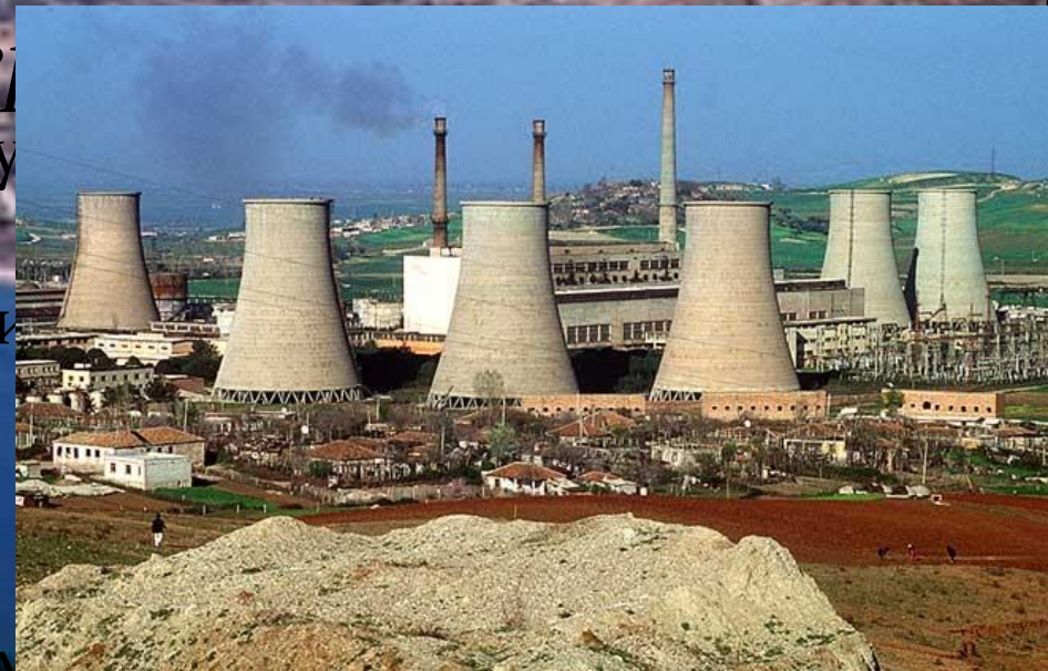
Завод по добыванию полезных ископаемых в Албании