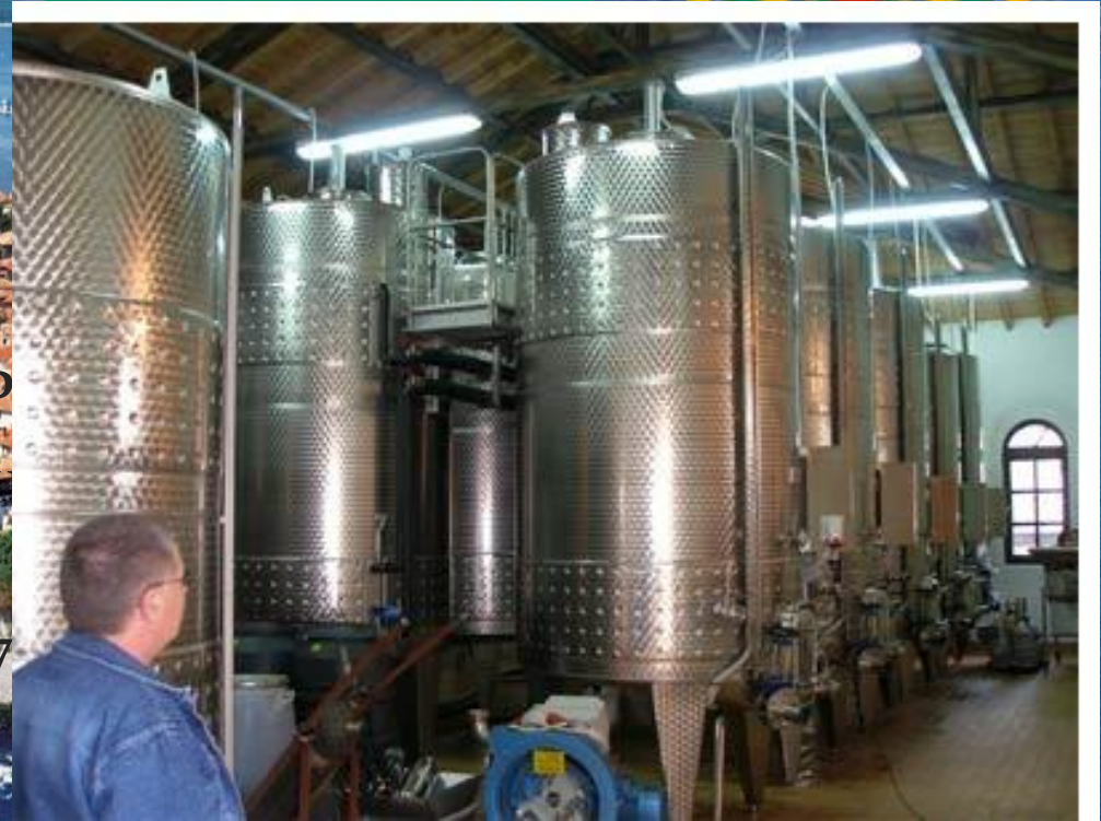
Завод по производству вин в Болгарии

В стране имеются запасы угля и газа. Продуктивно развито сельское хозяйство, в особенности виноделие и производство табака. Официальное название — Р Расположена в Юго-Востоке Площадь - 11 тыс. км 2 Численность населения — 7 Столица — София Денежная единица — лев