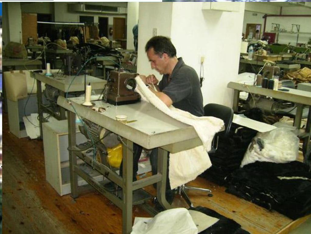
Текстильная промышленность Греции