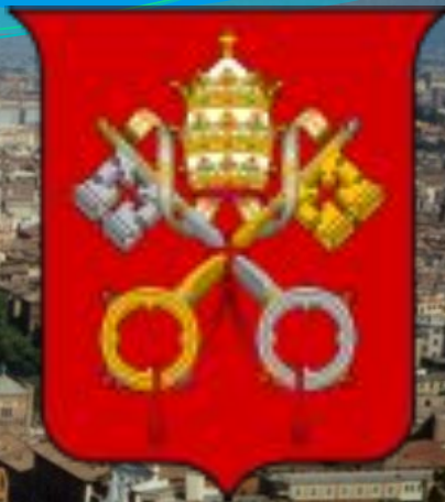
Флаг и герб страны

Оприносит туризм, продажа Ватиканских почтовых марок, ватиканских монет евро, сувениров и музеев.