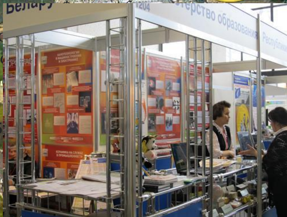
Промышленное предприятие Дании