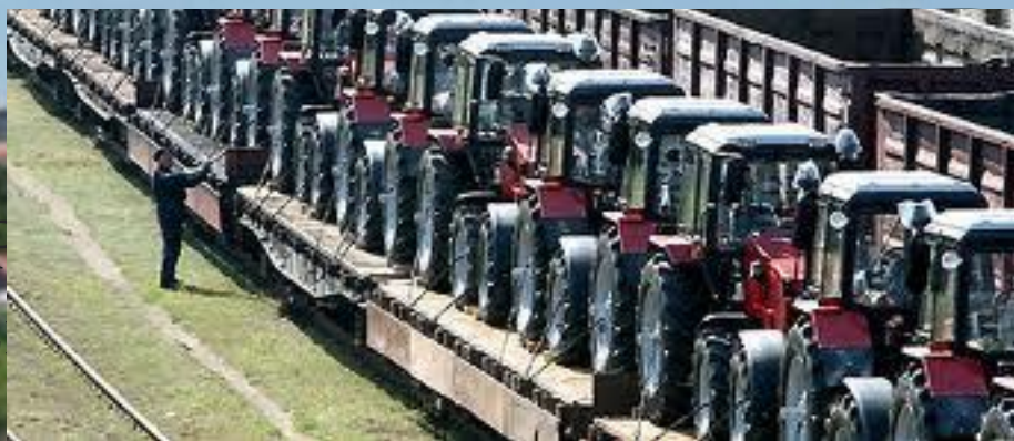
Пример машиностроения в Белоруссии