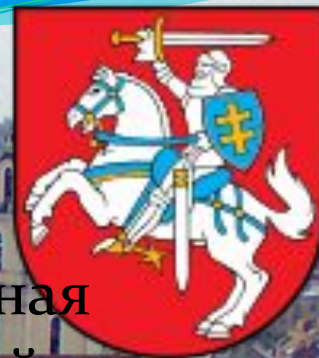
Флаг и герб страны

Официаль Расположе Площадь 6 численнос Столица Денежит