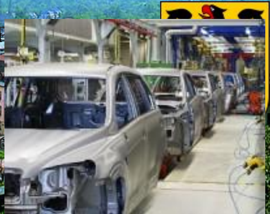
Завод по производству автомобилей в Германии