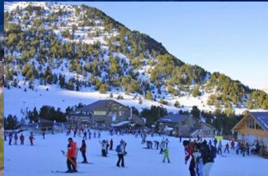
Туристическая база в Андорре