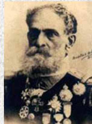
Деодоро да Фонсека