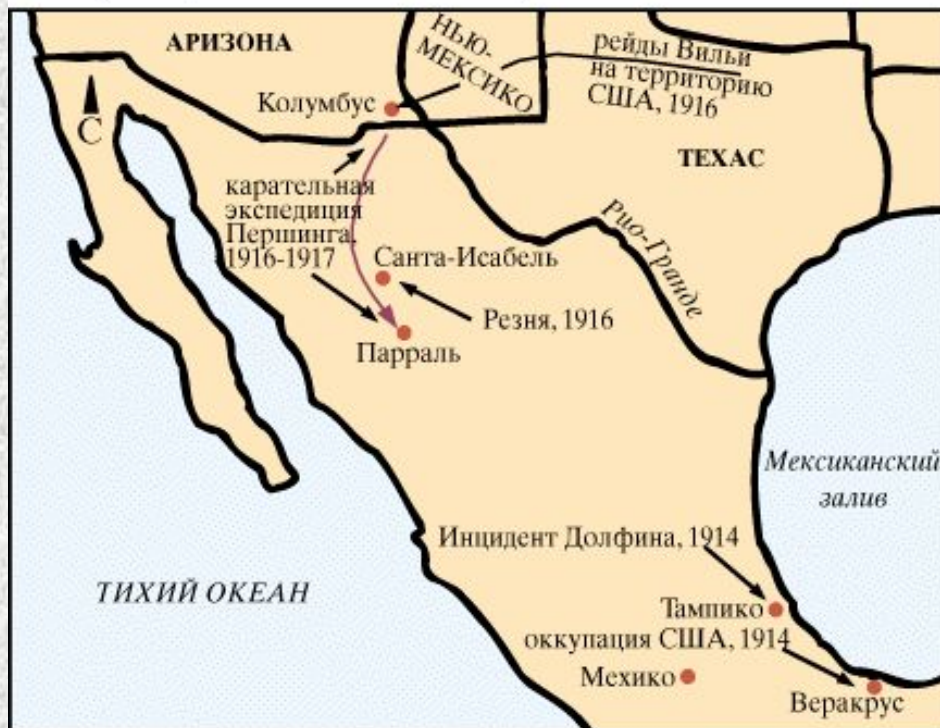
Интервенция США в Мексике, 1914-1917