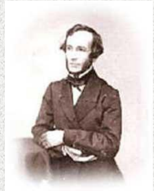
Хуан Баутиста Альберди, собственной персоной