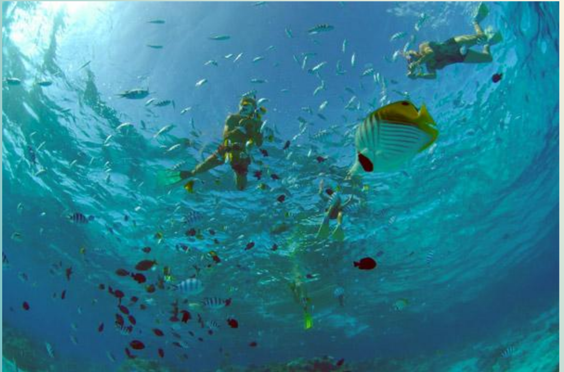
Дайвинг в море