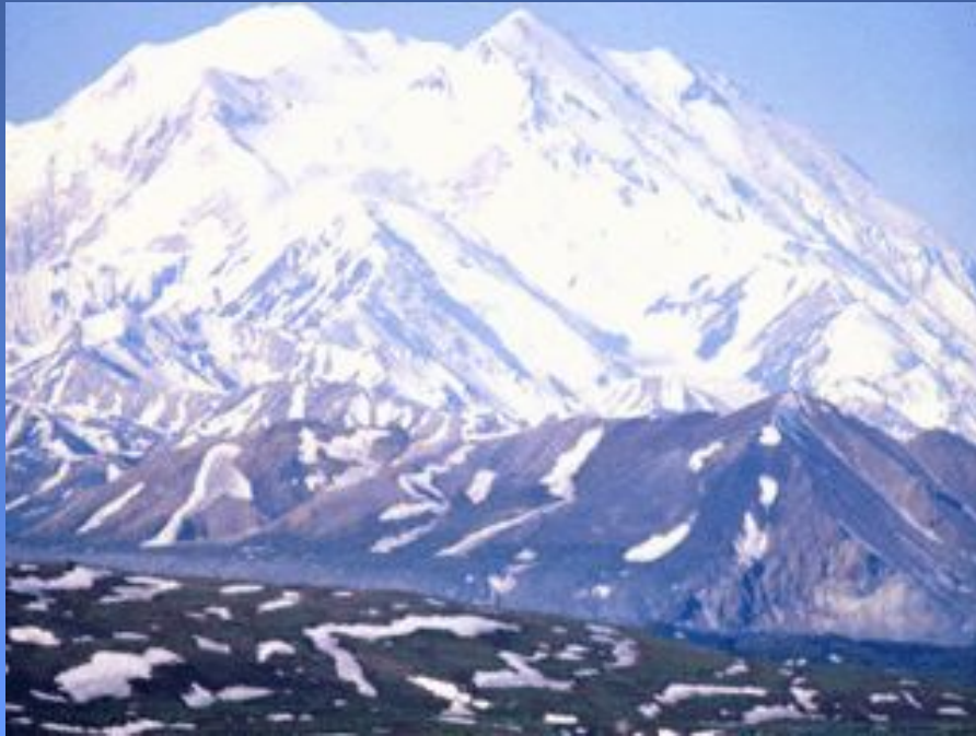
Гора Мак -Кинли