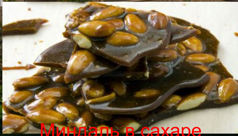
Миндаль в сахаре