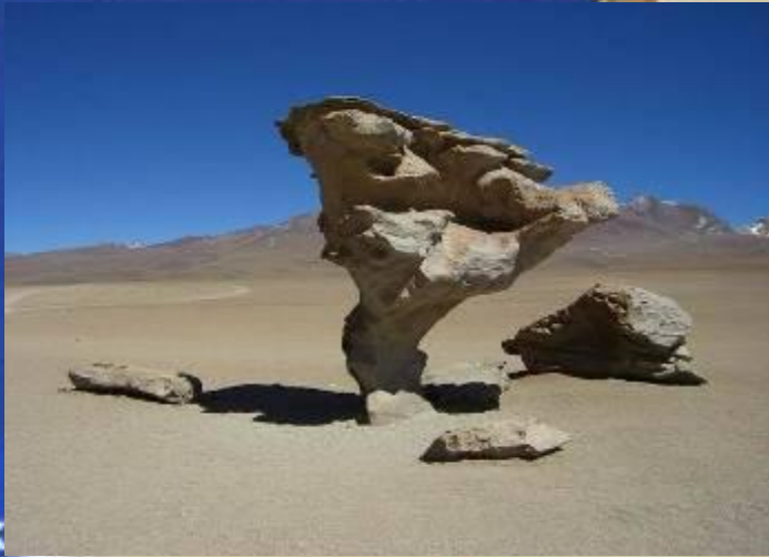
Название изображения: South America_054.jpg