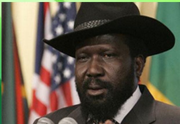
Салва Киир, президент.

Государственный строй – президентская республика.