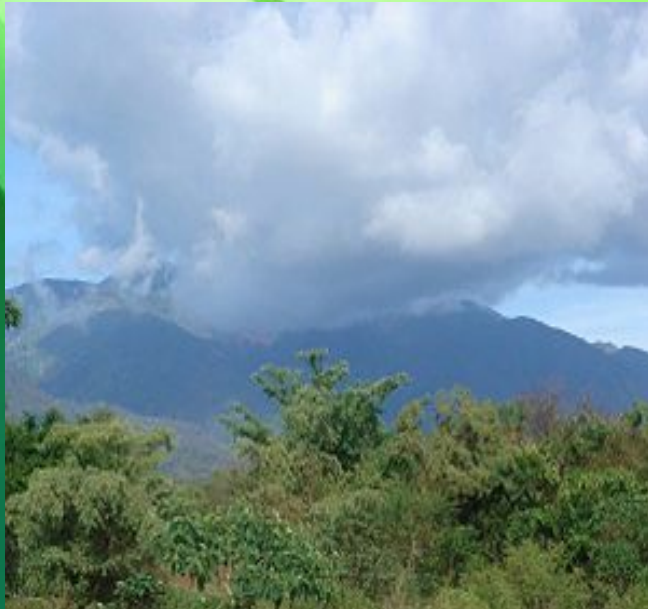
Национальный парк в Бома

Весь Южный Судан покрыт лесами, которые делятся на две части. Это — муссонные (тропические) леса — на юге, и экваториальные — на крайнем юге, то есть муссонные (25%), и экваториальные (5%). По долинам рек растут галерейные леса. В галерейных лесах Южного Судана можно встретить красное дерево, один из видов тика, лиану-каучуконос ландольфию. Отроги Центральноафриканского плоскогорья и Эфиопского нагорья покрыты горными лесами.