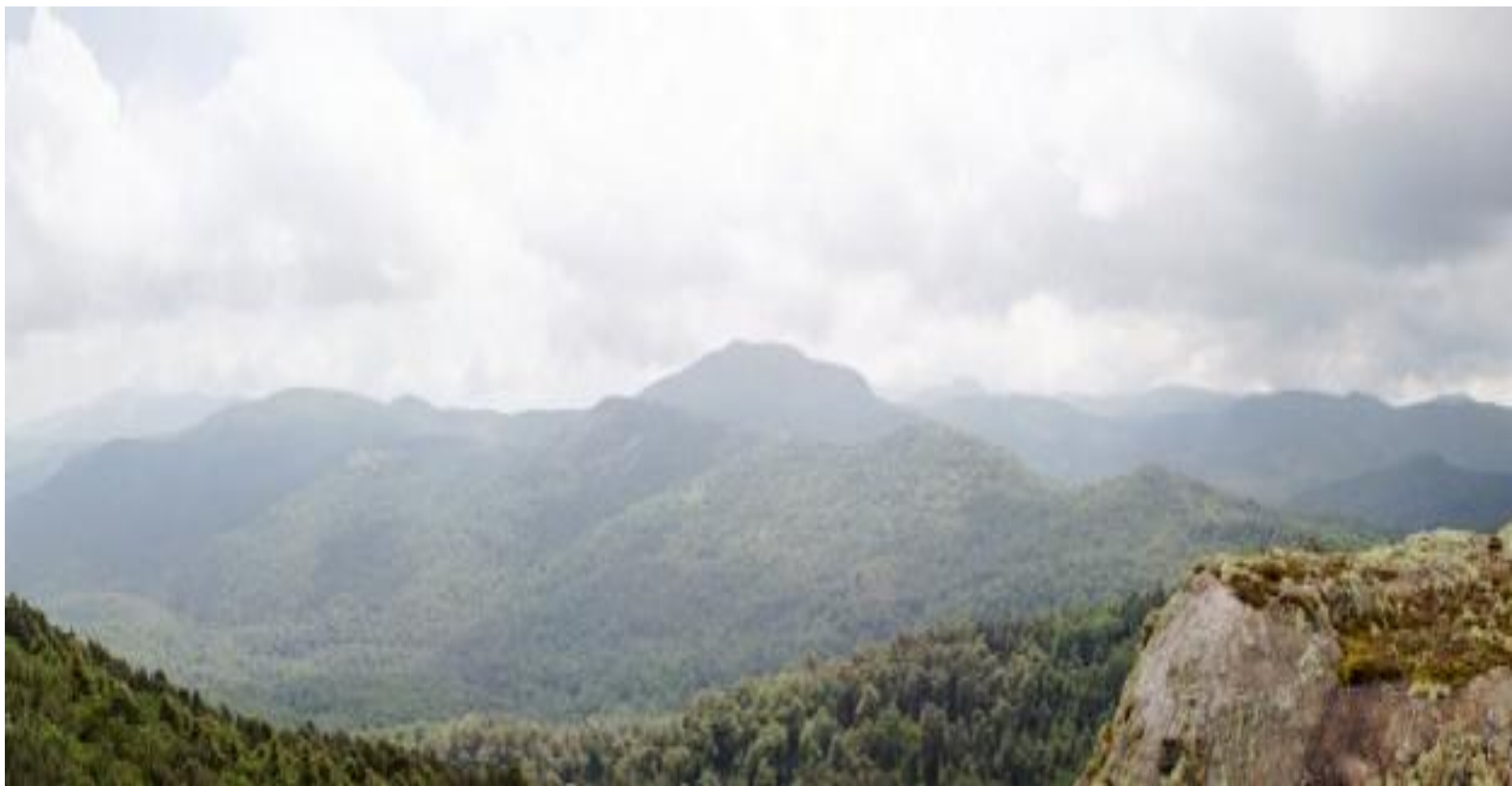
Гора Киньети (3187 м)