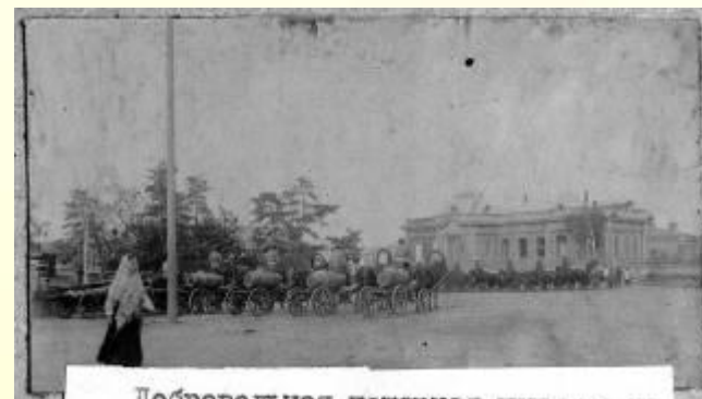
Добровольное Пожарное общество