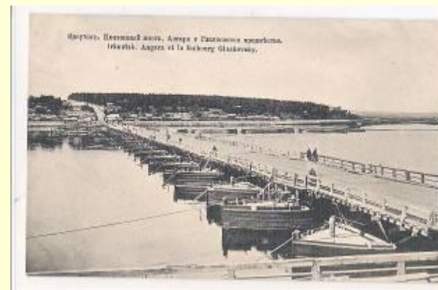
Понтонный мост через Ангару