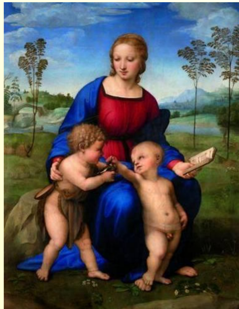
Рафаэль «Мадонна со щеглѐнком»