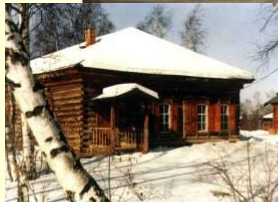
Иркутск в 80-е гг. XIX века