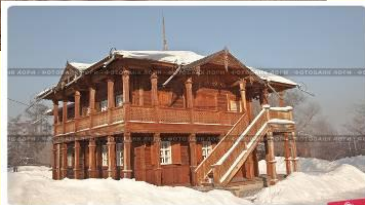
Усадьба для прислуги. Дом музей -усадьба Сукачёва г. Иркутск