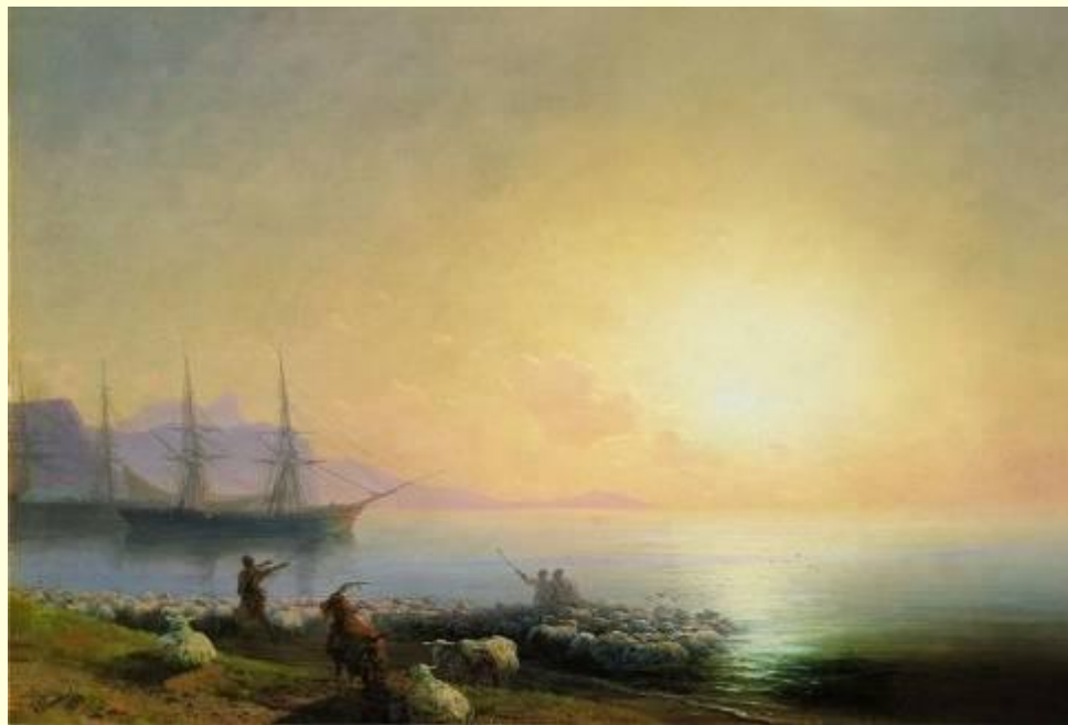
Айвазовский Купание овец. 1877.

Для своей картинной галереи он приобрел полотна Репина, Платонова, Маковского, Верещагина, Айвазовского.