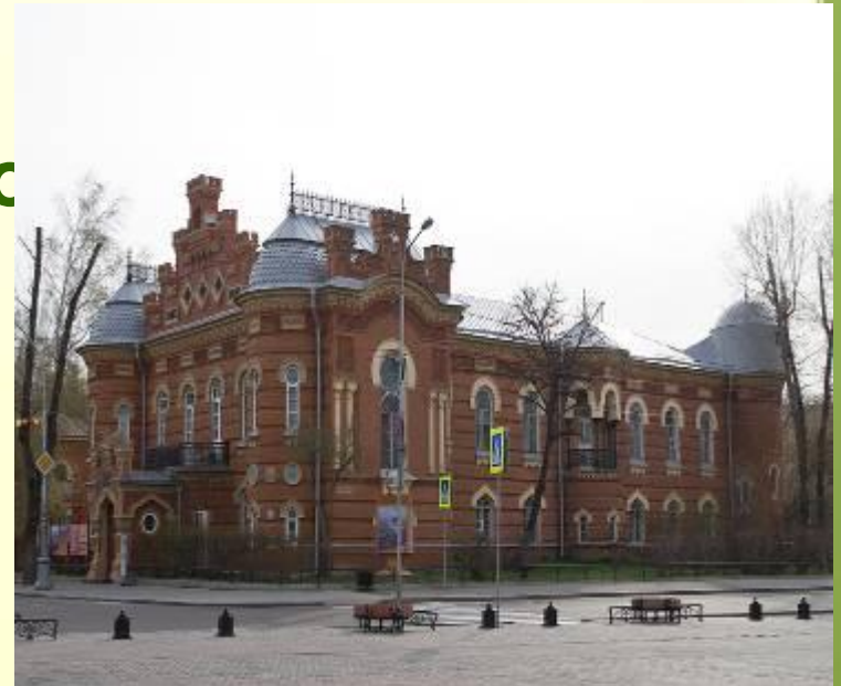
Здание Восточно-Сибирского отдела Императорского Русского Географического общества

Он пожертвовал значительные средства обществу, профинансировал отдельные экспедиции, подарил ВСОИРГО 143т. ценных научных и художественных изданий.