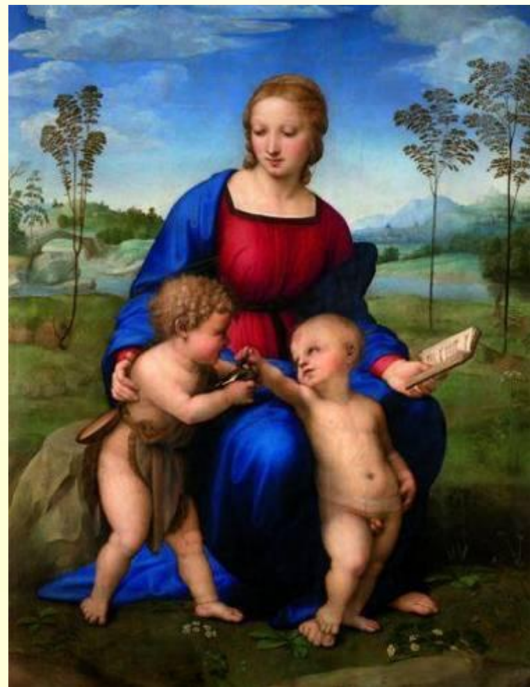
Рафаэль «Мадонна со щеглёнком»