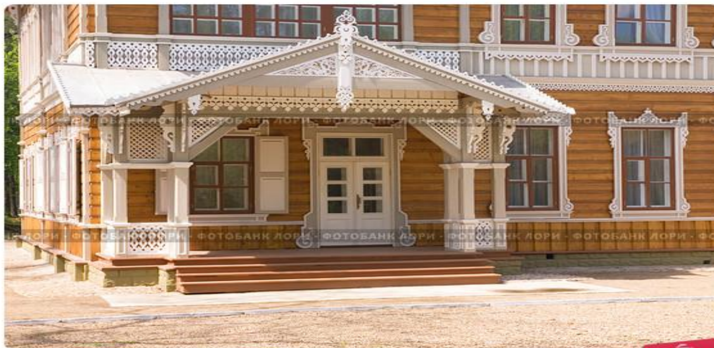
Усадьба Сукачева В. П., картинная галерея, конец 19-го века

Доступ в картинную галерею Сукачева был открыт для всех желающих в воскресенье, а учащиеся учебных заведений Иркутска могли посещать музей по договоренности с хозяином в любой день недели.