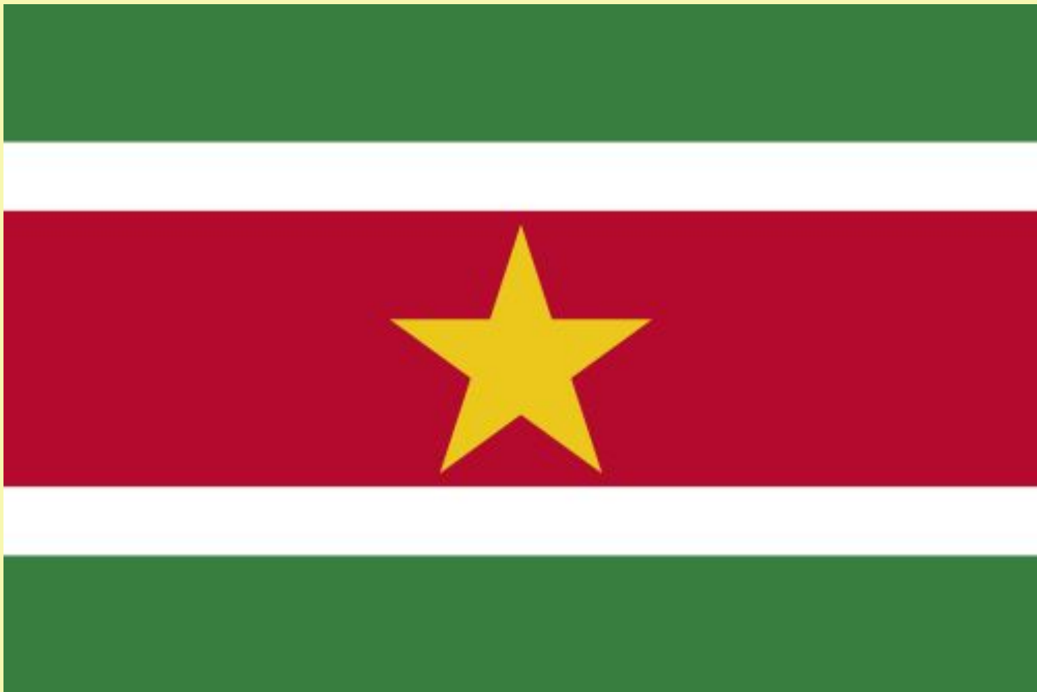
• Флаг Суринама