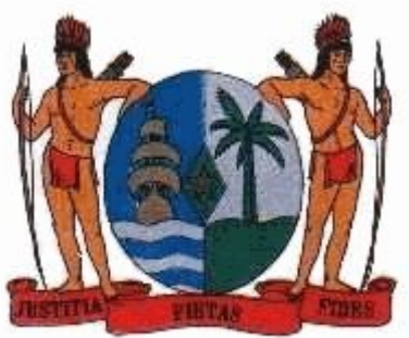
HET WAPEN VAN SURINAME