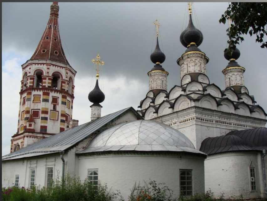
Соборы Спасо-Ефимьевского монастыря в Суздали