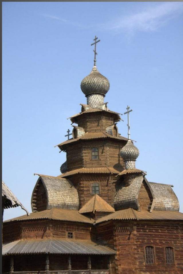
Музей деревянного зодчества