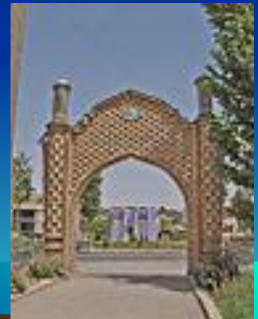
Арка в Истаравшане

Таджикиста́н ( тадж. Тоҷикистон), официально Респу́блика Таджикиста́н ( тадж. Ҷумҳурии Тоҷикистон ) — государство государство в Центральной Азии , бывшая Таджикская Советская Социалистическая Республика бывшая Таджикская Советская Социалистическая Республика в составе СССР .