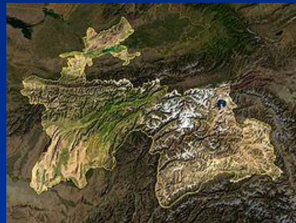
Снимок территории Таджикистана со спутника