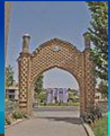
Арка в Истаравшане

Таджикиста́н ( тадж. Тоҷикистон), официально Респу́блика Таджикиста́н ( тадж. Ҷумҳурии Тоҷикистон ) — государство в Центральной Азии , бывшая Таджикская Советская Социалистическая Республика в составе СССР .