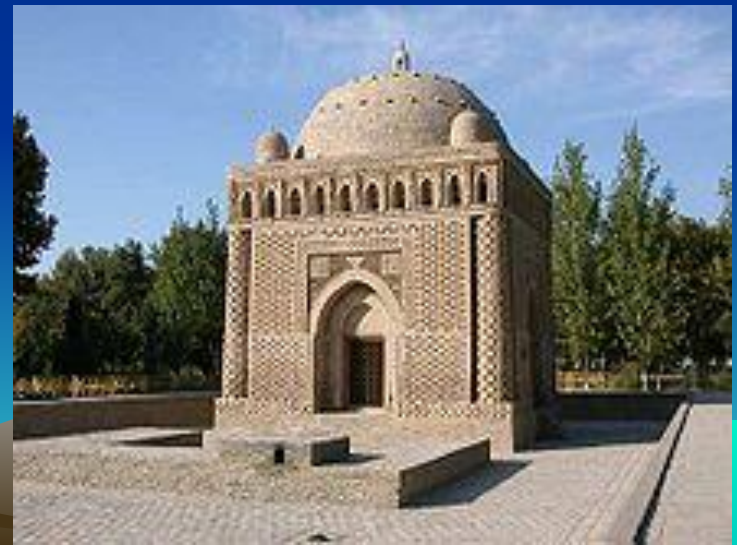
Мавзолей Исмоила Сомони