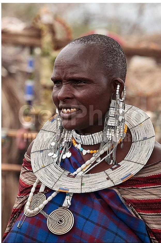
# rvn21001027930 Ngorongoro National Park, Tanzania