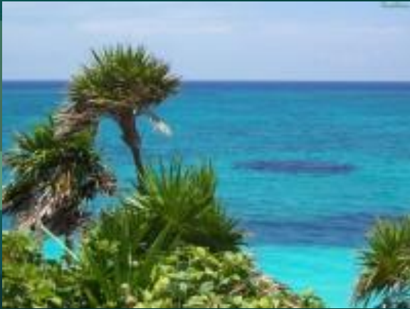
Остров Мадагаскар, Индийский Океан

Это огромная экосистема, условно разделенная на связанные между собой части: Атлантический, Тихий, Индийский и Северный Ледовитый океаны.