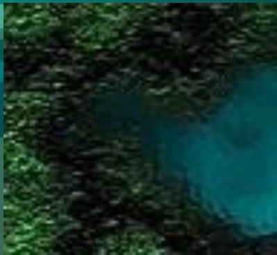
На дне Океана