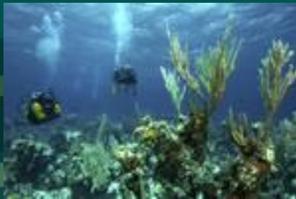
На дне океана

В тропиках лучи солнца попадают в воду почти под прямым углом и проникают на глубину 200-250 м. Ближе к полюсам они скользят по поверхности воды и проникают на гораздо меньшую глубину. Поэтому зона фотосинтеза в тропиках гораздо разнообразнее. По мере удаления от суши живой мир океана также меняется.