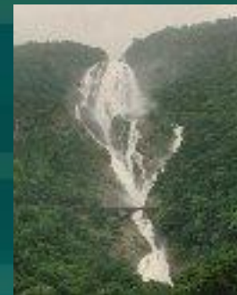
Поступление Воды В море