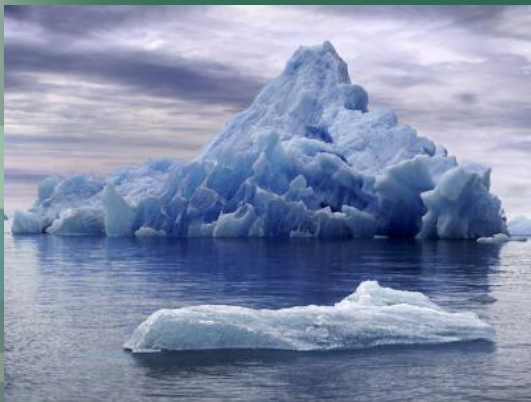
Материковый Водоем и Лед

Жизнь и вода тесно связаны. Предания многих народов говорят о том, что жизнь на Земле зародилась в воде. Водная оболочка земли, именуемая гидросферой, состоит из океанов, морей, материковых водоемов и льдов. На Мировой Океан приходится 71% поверхности земного шара. Этот огромный мир со своими обитателями живет по особым законам. Как и на суши, в океане есть свои горы, возвышенности, равнины, низменности и глубокие впадины.