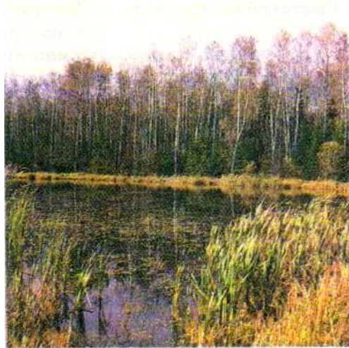
Болото в тайге