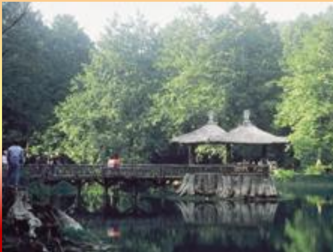
姊妹潭 - Пруд сестер