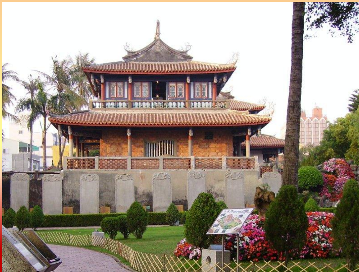
Тайнань. Храм Конфуция