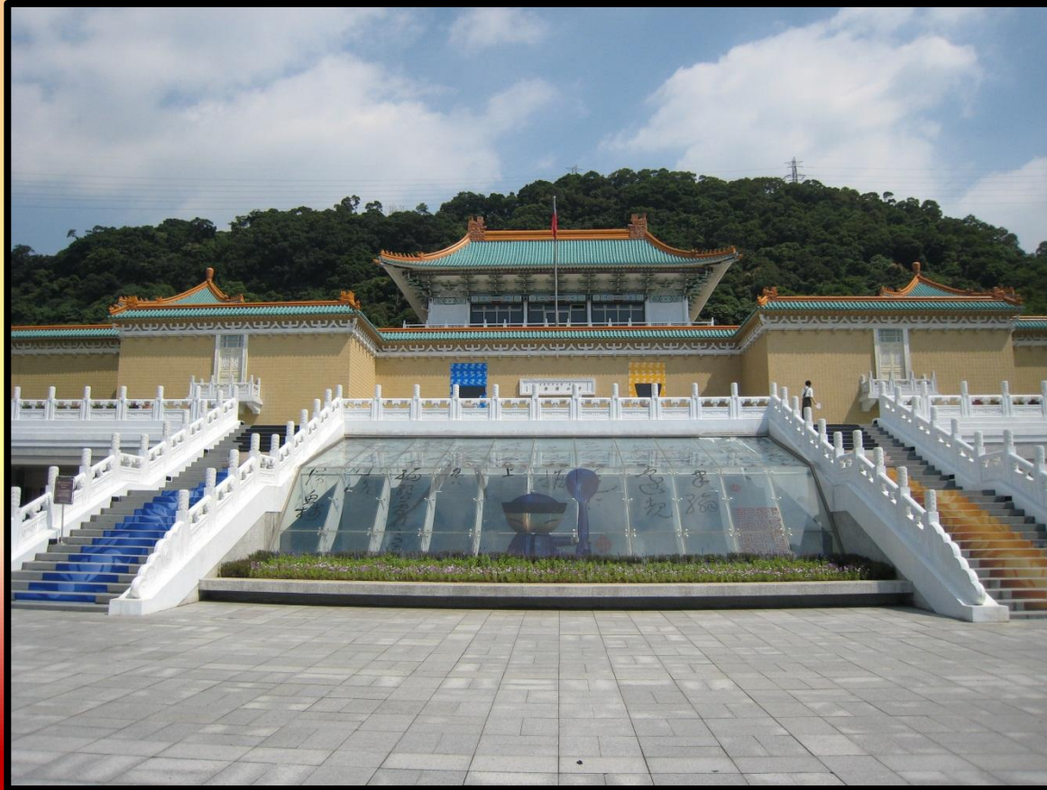
台湾故宫博物馆 - Дворец-Музей в Тайбэе Дворец-музей был построен в 1962 году и назван в честь Сунь Ятсена .