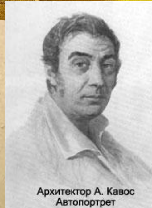
Архитектор А. Кавос Автопортрет

Он назван в честь Марии Александровны, жены царя Александра II. Здание театра построил архитектор Альберт Кавос.